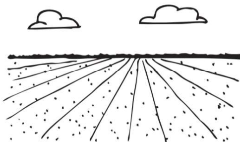
Afbeelding - Uitgestrekt grasland in strokenverkaveling met ruim zicht naar de horizon.

Landschappelijk gezien vormen de activiteiten van de ontheffingsaanvraag een aanvaardbare aantasting van het landschap van het Groene Hart. In dit gebied is de strokenverkaveling belangrijk, zie afbeelding 1. Om deze strokenverkaveling te behouden, beschermt de provincie Utrecht de lengtesloten. De te dempen watergang betreft een landschappelijk waardevolle lengtesloot. De demping betreft een gedeeltelijke demping van 1,5 meter over een lengte van 140 meter. De lengtesloot heeft momenteel een profielbreedte van 5 meter. Met de gedeeltelijke demping krijgt de lengtesloot over de lengte van 140 meter een smaller profiel. Hierdoor blijft de lengtesloot behouden als landschappelijke structuur. De gevraagde werkzaamheden zijn landschappelijk aanvaardbaar omdat de lengtesloot slechts gedeeltelijk gedempt wordt en de zichtbaarheid vanuit de omgeving op de lengtesloot door het bos en de hockeyvelden zeer beperkt is.