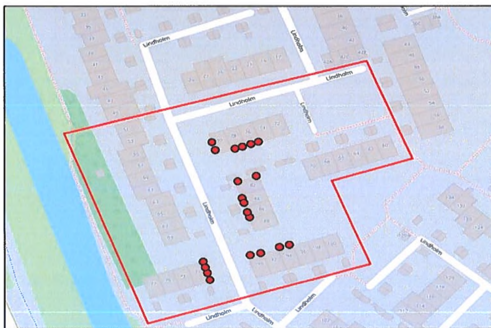
Figuur 3. Locaties inmetsele kasten ter compensatie huidige vleermuis verblijfplaatsen.