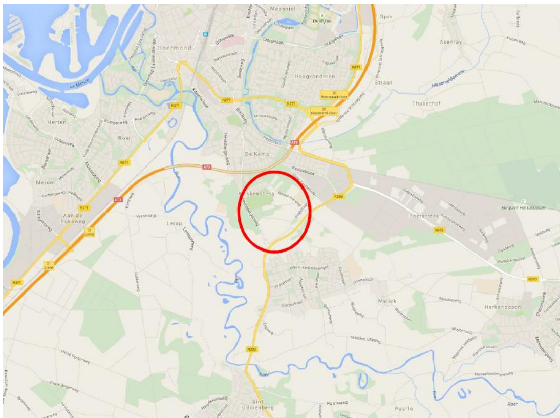
Figuur 1: Globale ligging van het projectgebied