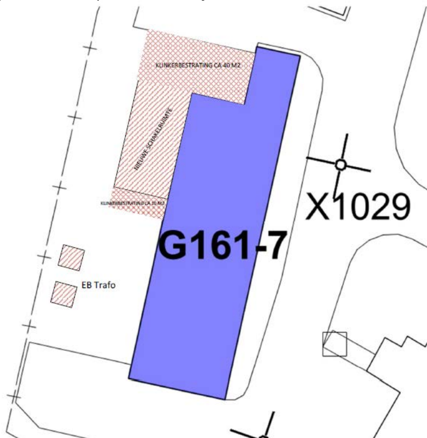
Figuur 2 - Bron: Tekening 5896.5, terreinindeling en verharding, de dato 13 maart 2017