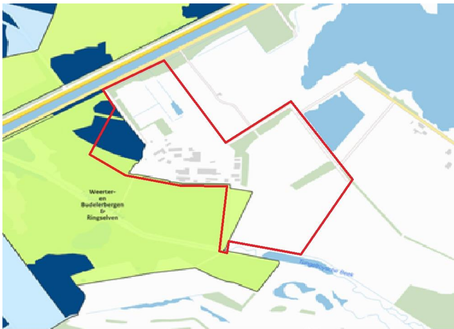
Afbeelding 4: Leefgebied nachtzwaluw, Lg13: Bos van arme zandgronden (donkerblauw)

De nachtzwaluw is gebonden aan droge, zandige gebieden zoals randen van zandverstuivingen, zandige heidevelden en duinen met verspreide opslag, open vlaktes ontstaan door kaalslag, storm of brand, hoogvenen en jonge houtaanplant of open bossen. De soort foerageert in de directe omgeving van het nest in vergelijkbare biotopen en langs bosranden.