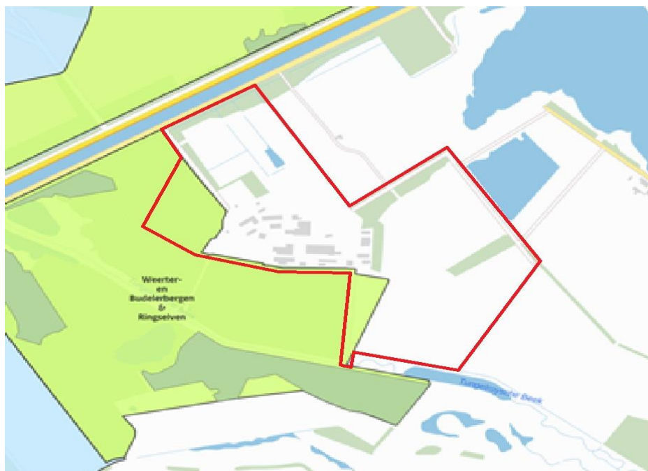
Afbeelding 5: habitattype H91D0 Hoogveenbos (donkergroen)

Het habitattype hoogveenbos bevindt zich niet binnen het plangebied, zie onderstaande afbeelding 4. Het habitattype hoogveenbos (H91D0) ondervindt geen significant negatieve effecten ten gevolge van de saneringswerkzaamheden of de herinrichting. Op den duur zal de herinrichting van het terrein dit habitattype ten gunste komen.