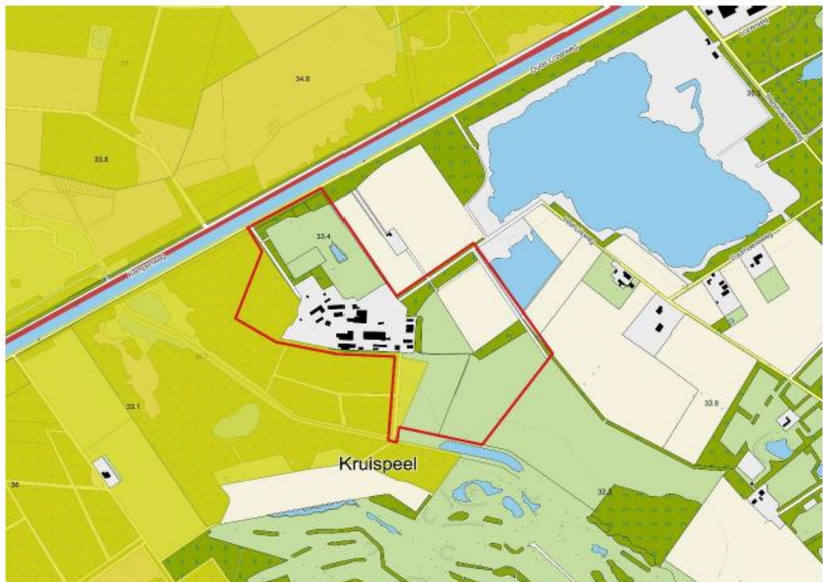
Afbeelding 1: Plangebied met rode omlijning weergegeven. In geel is het Natura 2000-gebied 'Weerter- en Budelerbergen & Ringselven' weergegeven.

Aan de zuid- en westzijde wordt het plangebied begrensd door berken- en elzenbroekbossen van de Kruispeel, aan de noordzijde door de Zuid-Willemsvaart, aan de oostzijde door een aantal agrarische percelen en de zandwinplas van de Centrale Zandwinning Weert B.V., zie afbeelding 1.