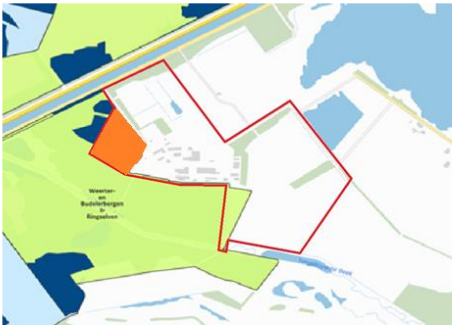
Afbeelding 2: Gebied (oranje) waar aanvulling met schone venige grond niet hoger mag worden opgehoogd dan de gemiddeld hoogste waterstand.

Het gebied waar grond in het kader van de sanering wordt verwijderd, wordt aangevuld met schone grond. In het oranje gebied als aangegeven in onderstaand figuur mag deze aanvulling niet verder worden opgehoogd dan de gemiddeld hoogste waterstand. De schone grond betreft venige grond afkomstig uit het nabij te ontwikkelen natuurterrein Q-percelen. De herinrichting zal worden gerealiseerd zoals weergegeven in bijlage 1.