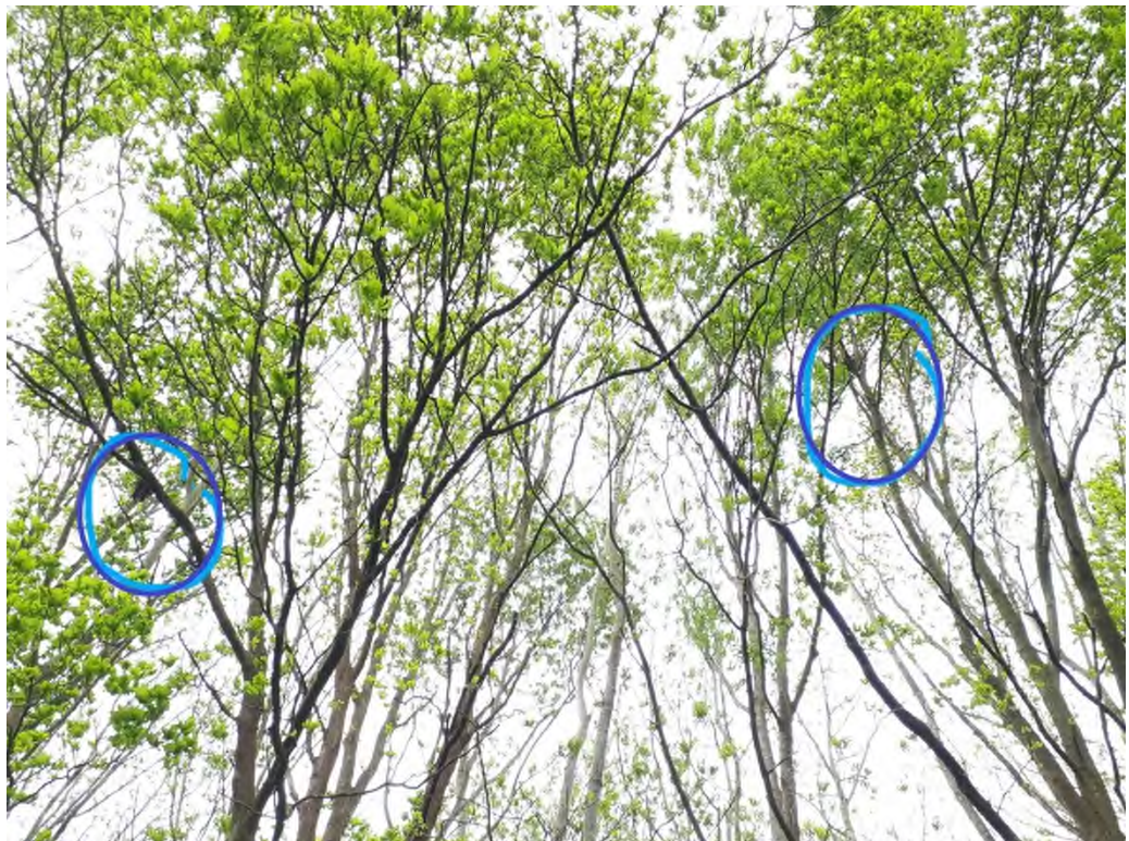
Figuur 2: Onderzochte mogelijk jaarrond beschermde nesten

Tijdens alle bezoeken zijn er geen broedende roofvogels aangetroffen op de onderzochte nesten. Tijdens het eerste bezoek kwam er één keer een sperwer overgevlogen maar deze kwam niet van een van de te onderzoeken nesten af. Zeer waarschijnlijk kwam deze vanaf een nest net buiten het projectgebied, ter hoogte van de kromsteeg (zie figuur 3). Het gebruik van de onderzochte potentiële jaarrond beschermde nesten kan uitgesloten worden.