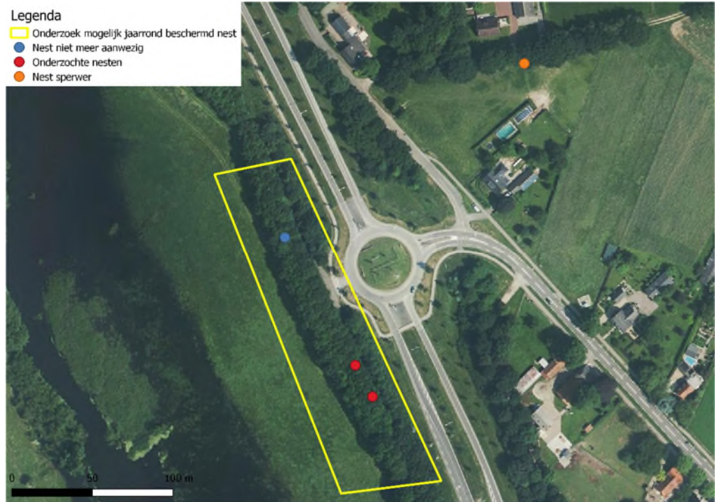
Figuur 3: Onderzochte mogelijk jaarrond beschermde nesten op kaart