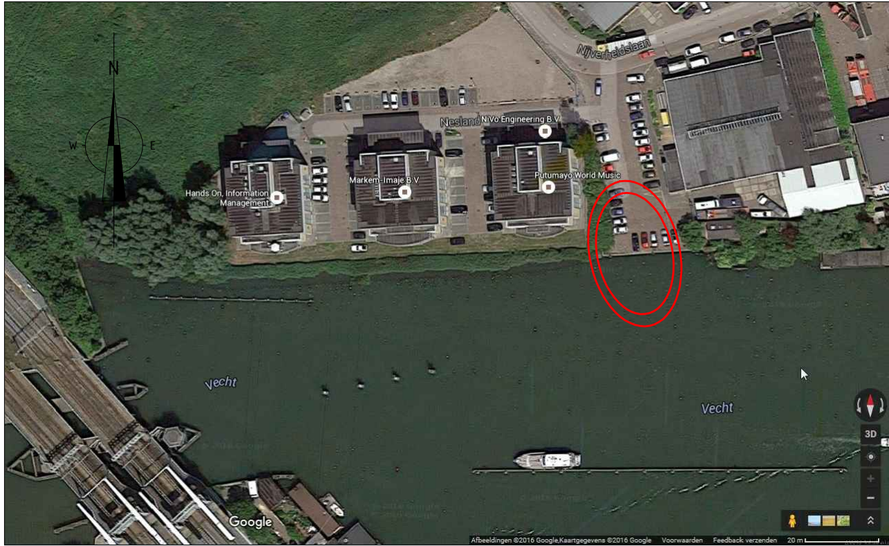
Overzicht Schaal n.v.t.