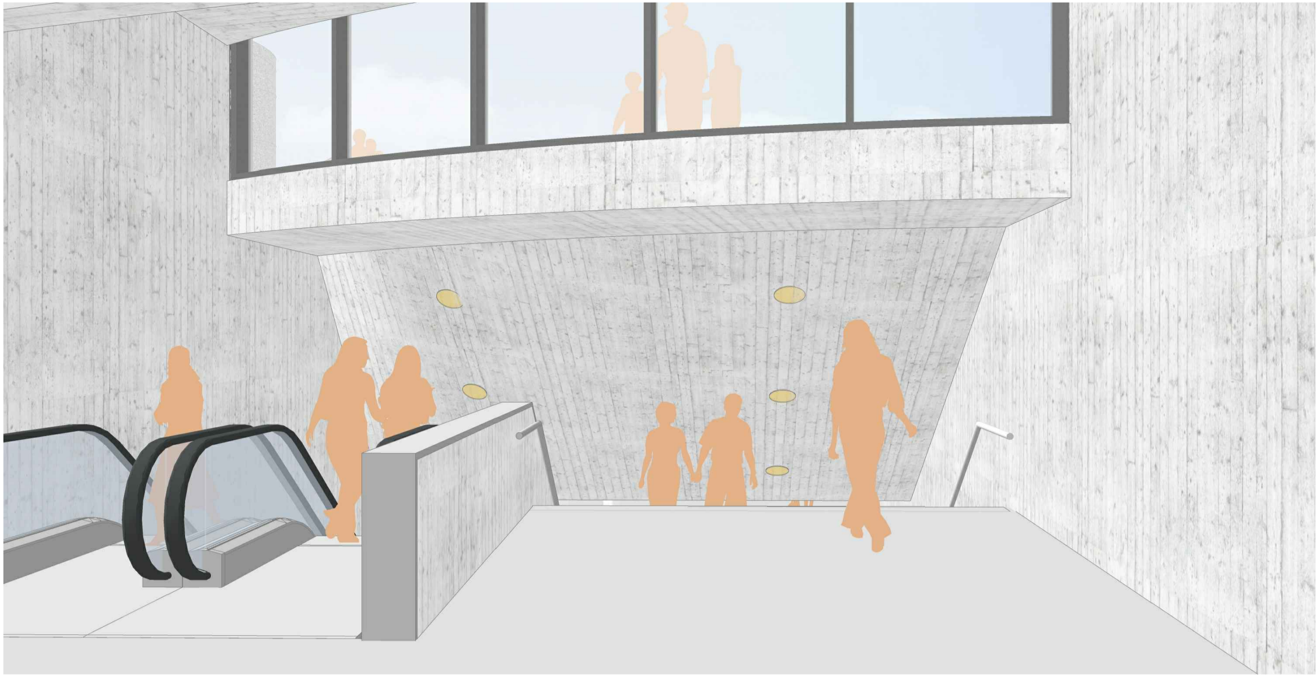
3D impressie interieur metroverbindingstunnel