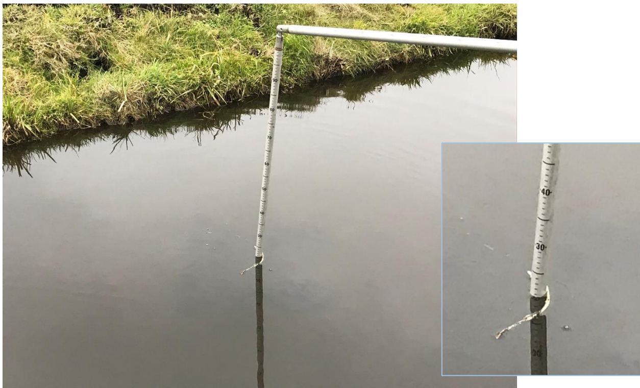
FOTO - punt 1 - onderkant baggerspecie