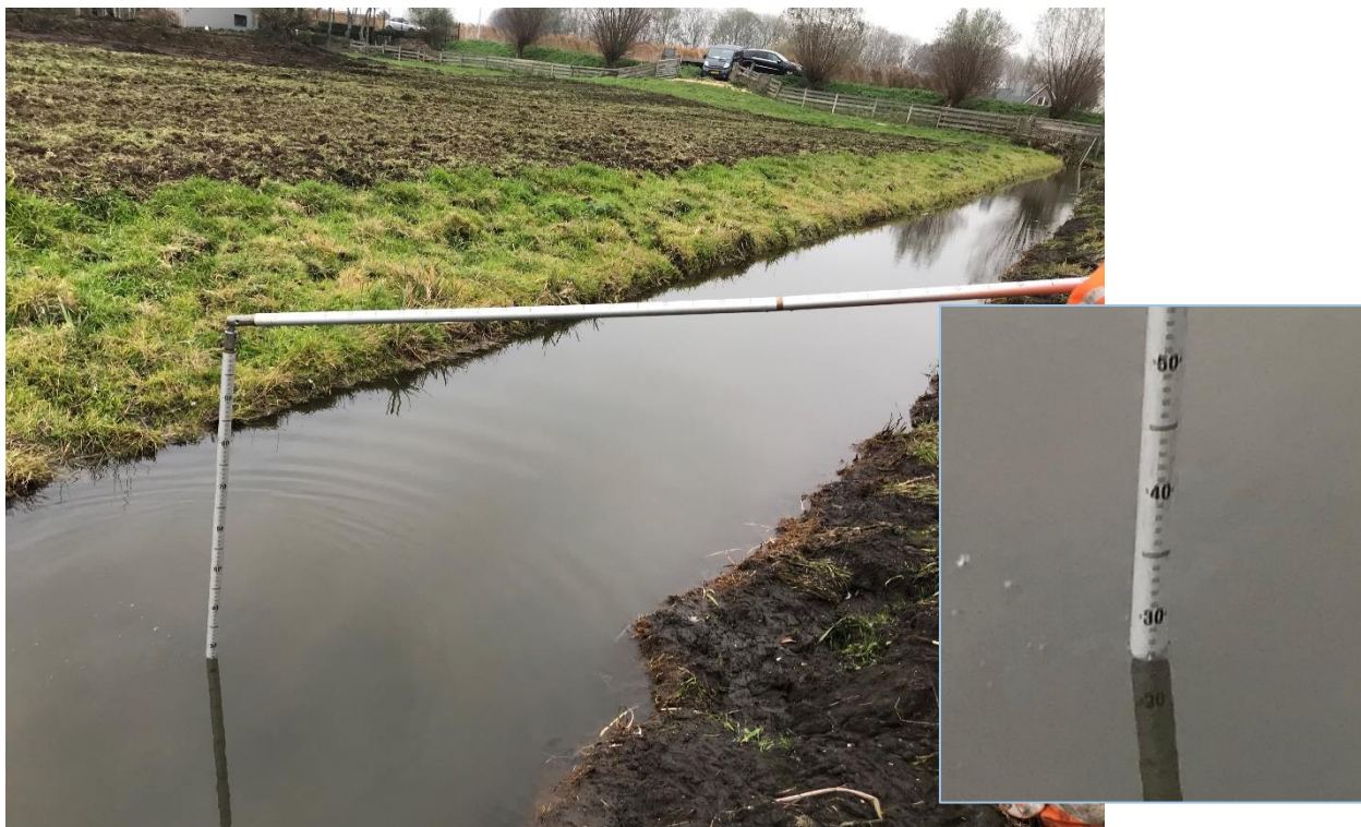
FOTO - punt 4 - onderkant baggerspecie