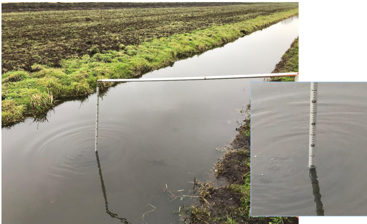
FOTO - punt 2 - onderkant baggerspecie