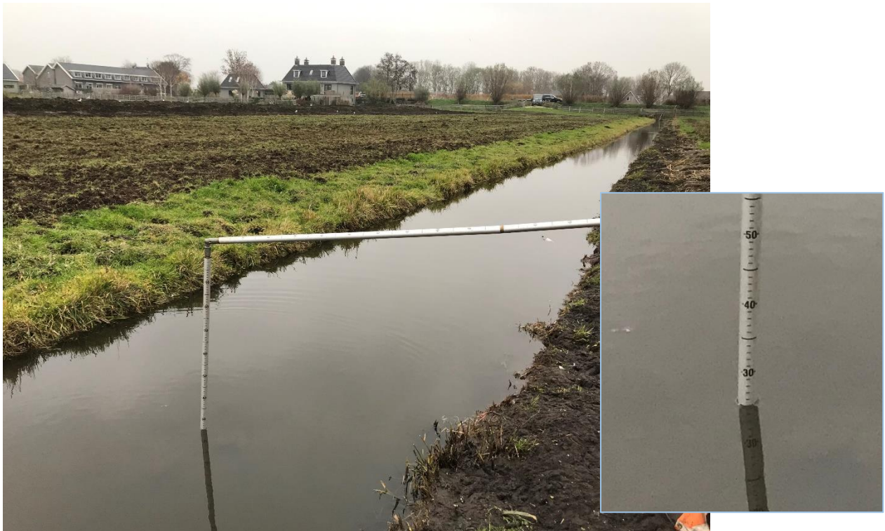
FOTO - punt 3 - onderkant baggerspecie