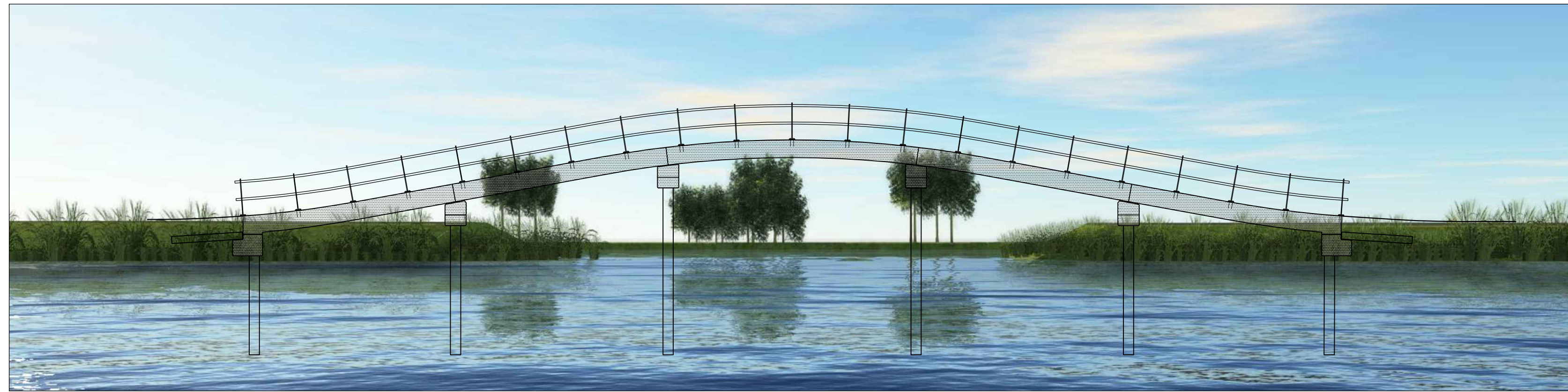
Aanzicht schaal 1:100