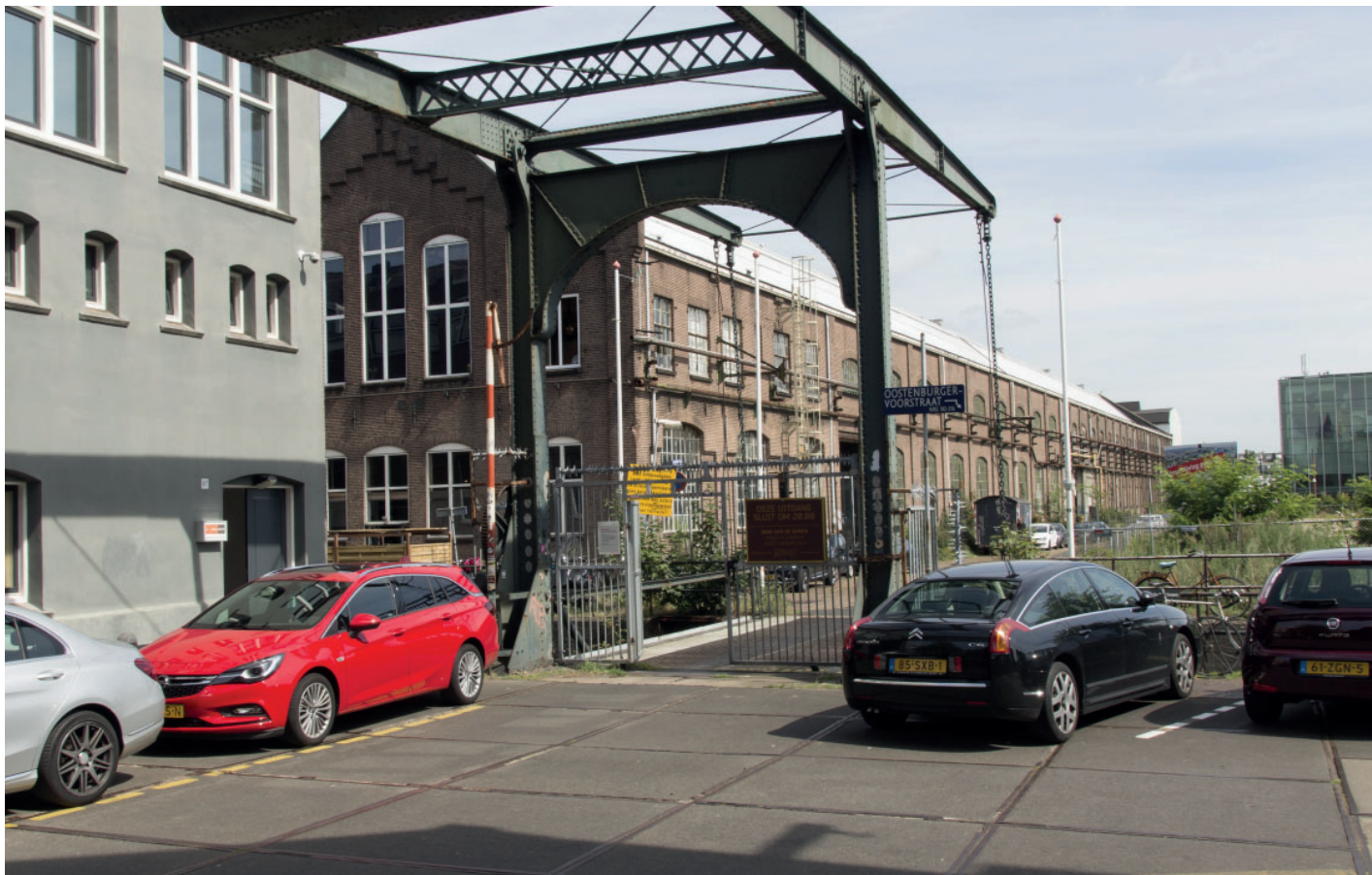
5. Zicht vanaf Oostenburgervoorstraat op brug naar kavel