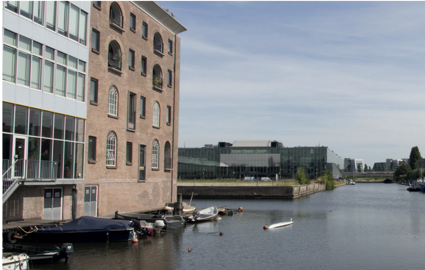
2. Zicht vanaf Oostenburgervaart (zuidelijk) op kavel en INIT-gebouw