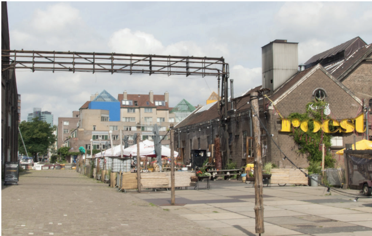
7. Zicht vanaf Oostenburgermiddenstraat op Amsterdam Roest