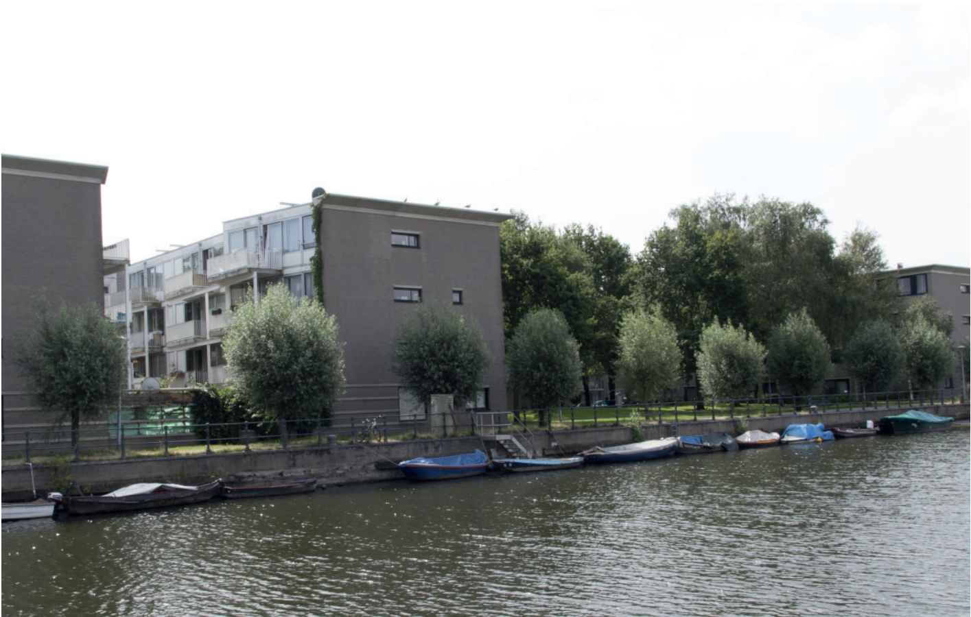
8. Zicht vanaf Isaac Titsinghkaade op bebouwing Conradstraat