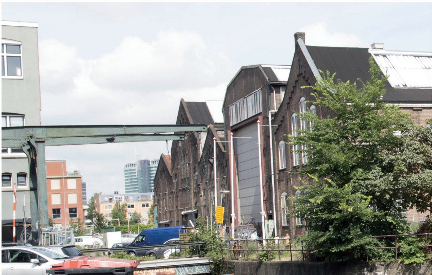
6. Zicht vanaf Oostenburgerdwarsvaart (oostelijk) op brug naar kavel en Van Gendthallen