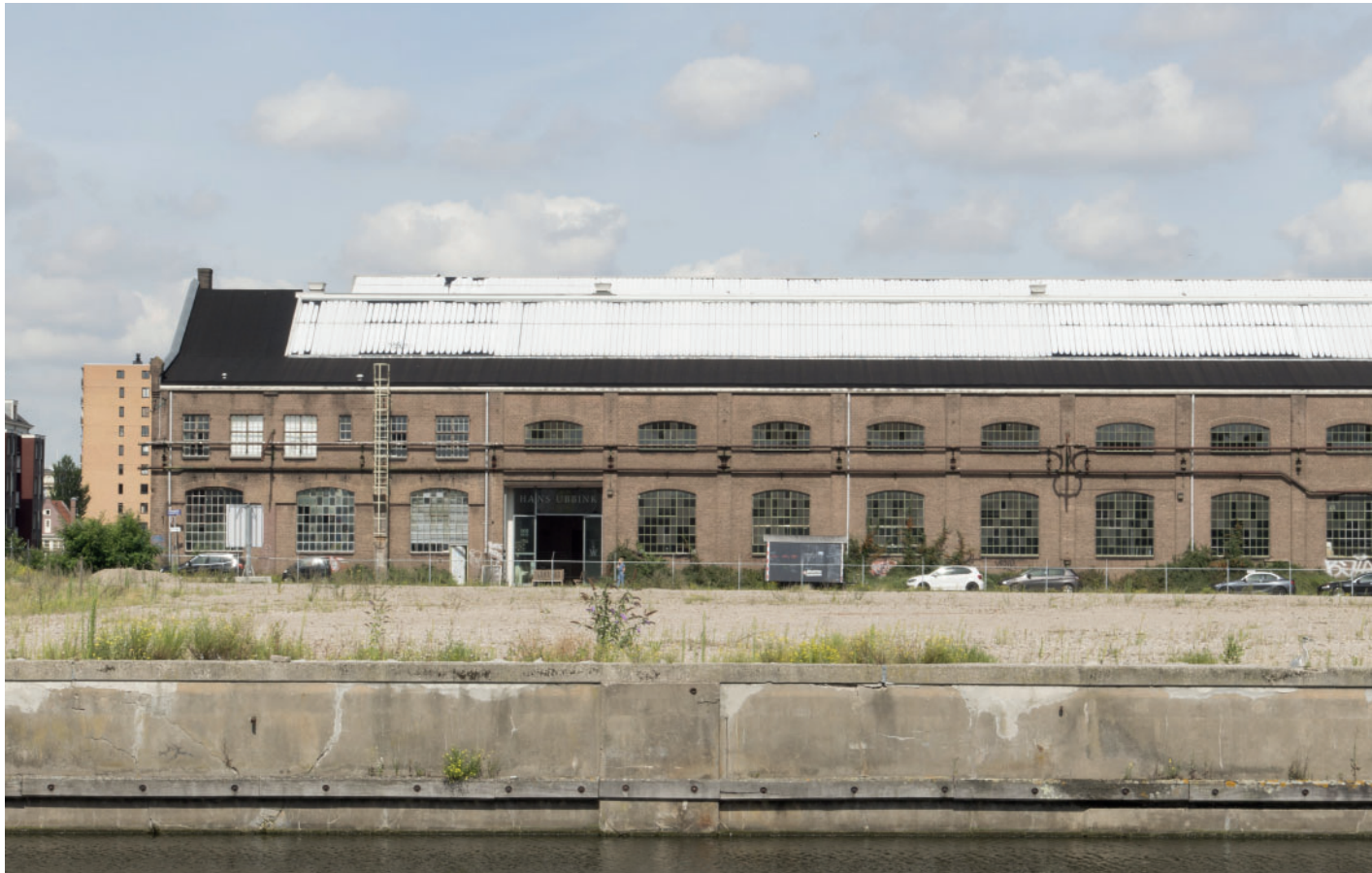
1. Zicht vanaf Oostenburgervaart (oostelijk) op kavel en Van Gendthallen