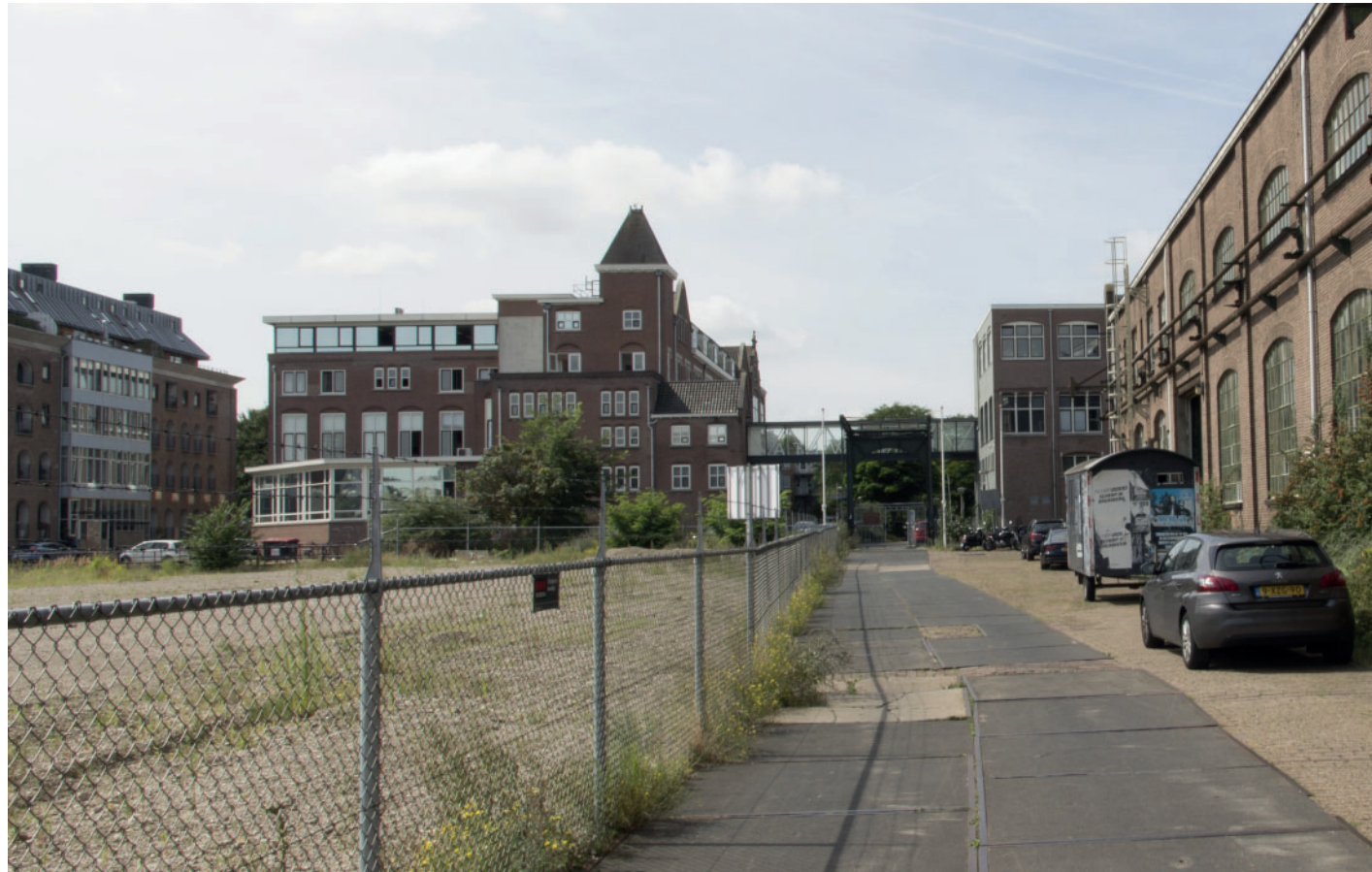
4. Zicht vanaf Jacob Bontiusplaats (noordelijk) op kavel