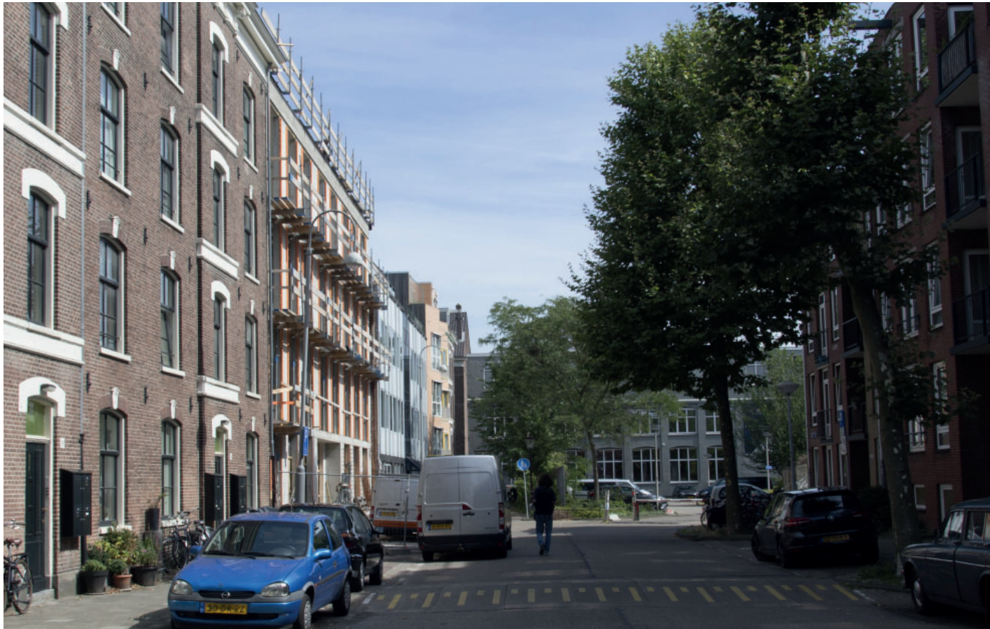
3. Zicht in de Oostenburgervoorstraat