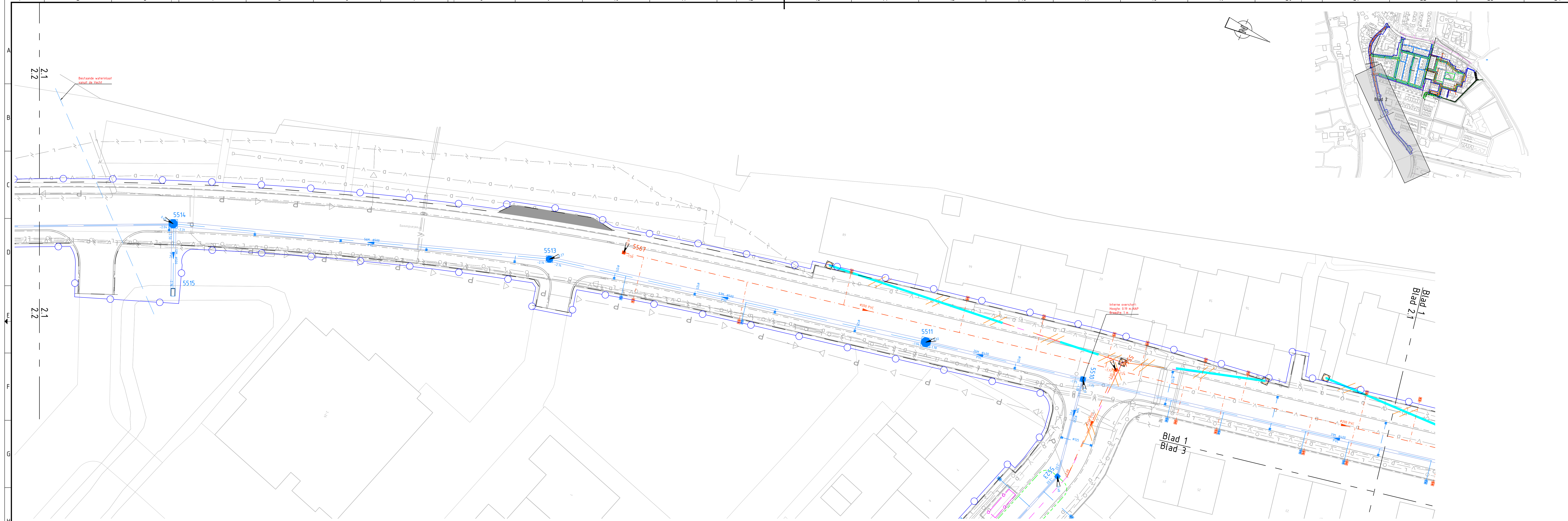
SITUATIE SCHAAL 1 : 200