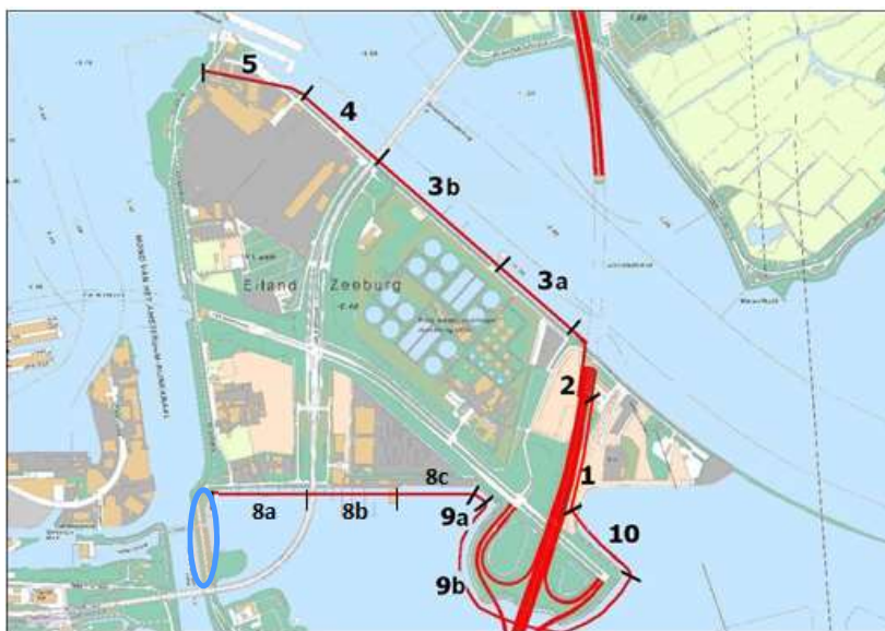
Figuur 1: Indeling in trajecten van de waterkering van het Zeeburgereiland en omcirkeld het deel van de Zuider IJdijk binnen de scope van de dijkversterking.

Het Zeeburgereiland (ZBE) wordt ontwikkeld tot een woongebied. Het gebied is onderhevig aan de golfslag van het Markermeer dat, in de Waterwet, als "buitenwater" is opgenomen. Voor de toekomstige ontwikkeling van het ZBE is daarom een volwaardige primaire waterkering nodig.