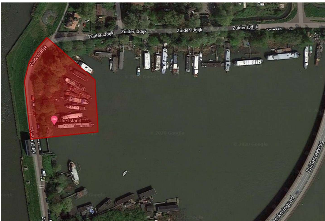
Figuur 2: scope uitbreiding tussen zuidelijke rand van het Zeeburgereiland en de sifon van Waternet