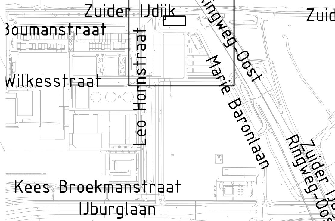
Overzicht werk Schaal 1:5000