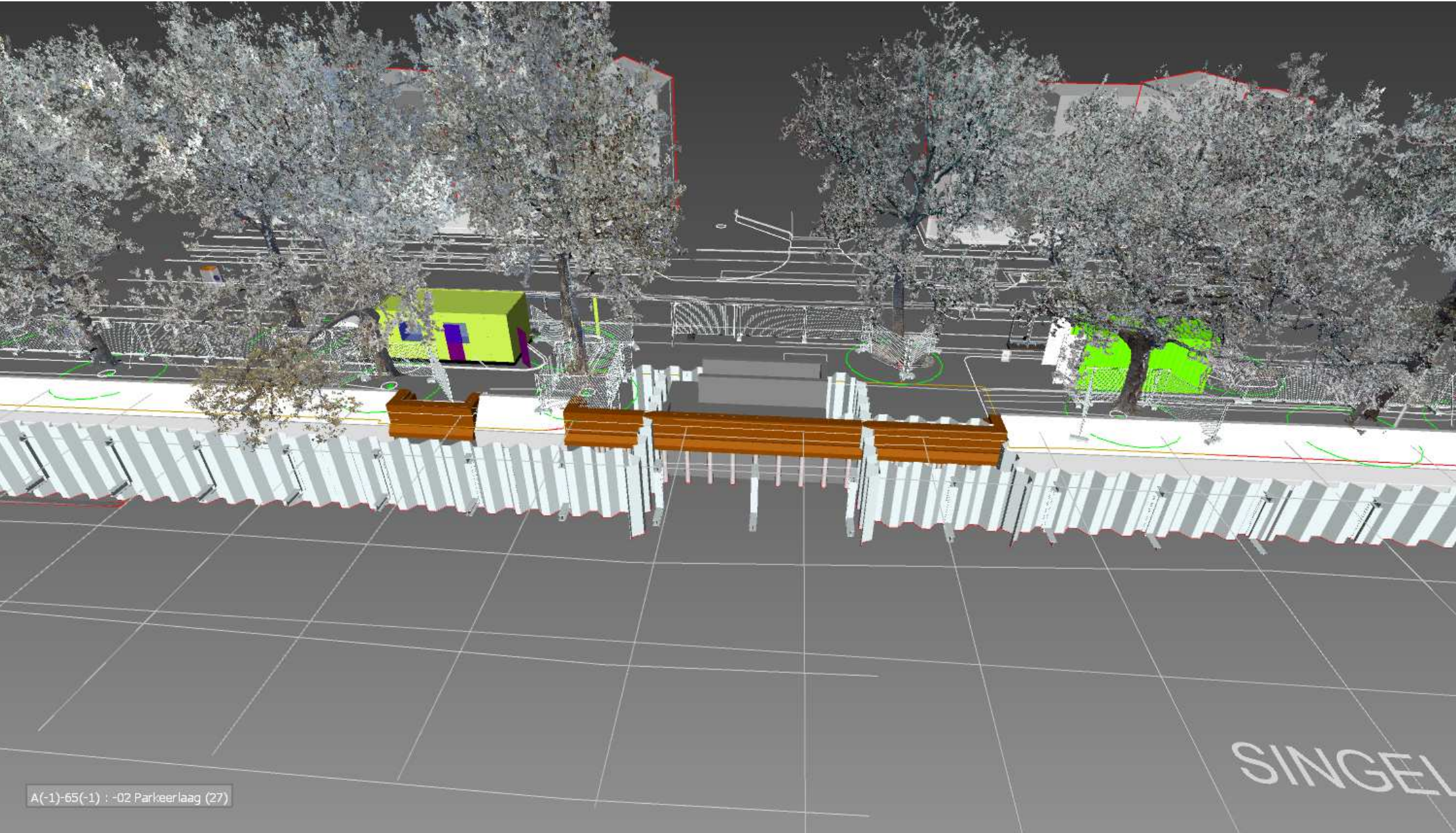
Kleine loskade: straatzijde

SCHAAAL 1: 500 - Week 41-2020 1/m week 27-2021