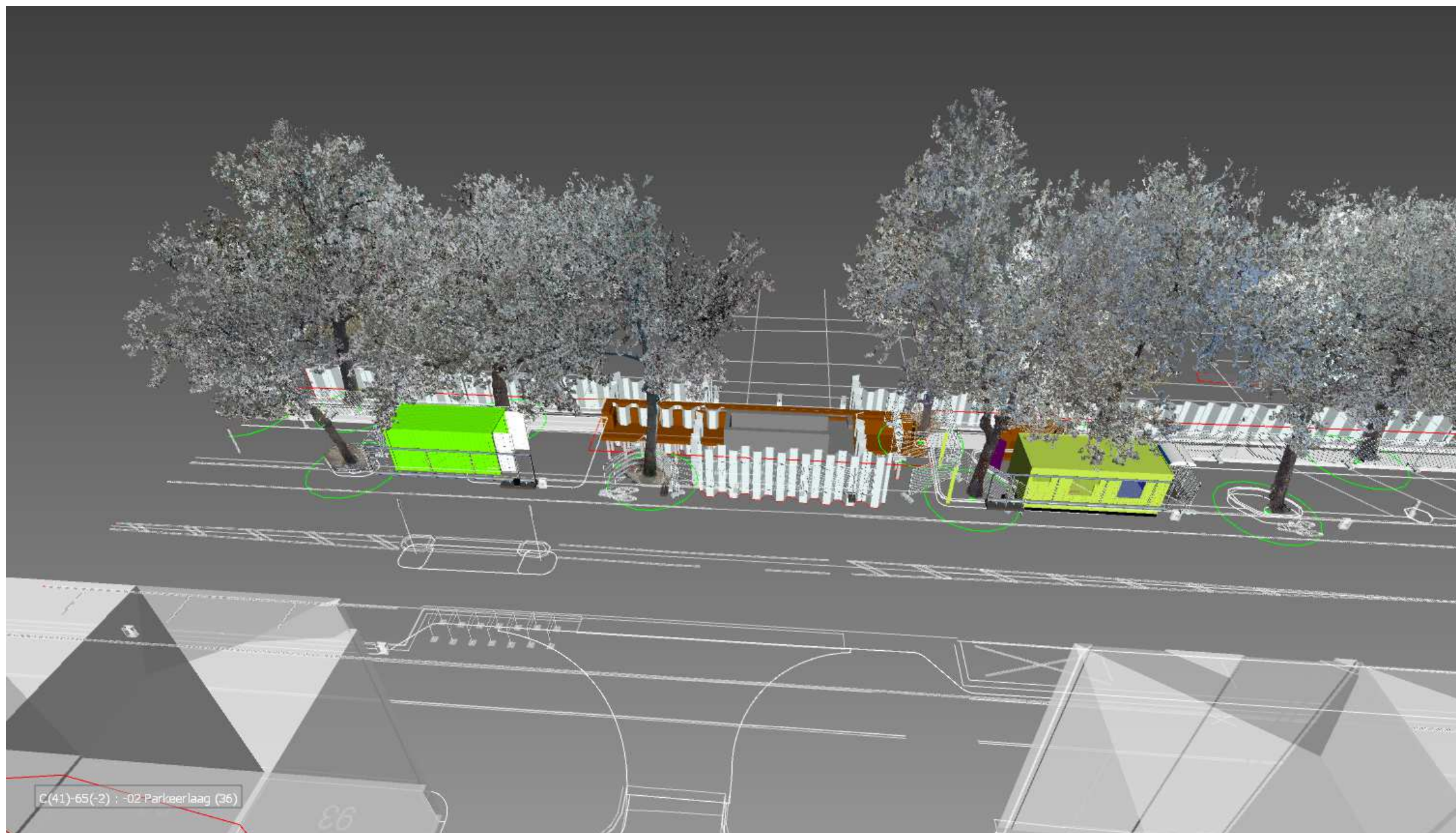
Kleine loskade: grachtzijde