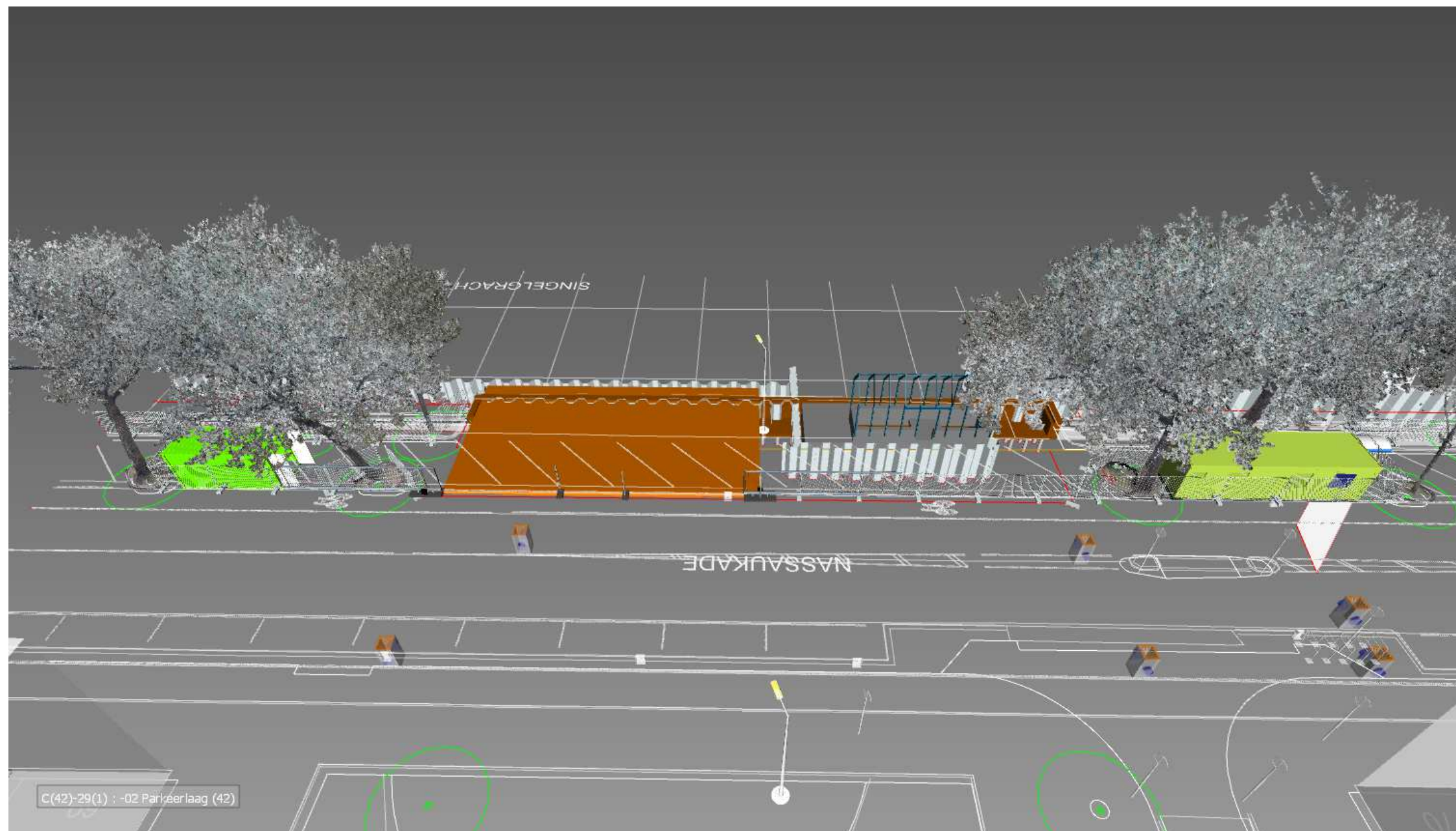
Grote loskade: straatzijde