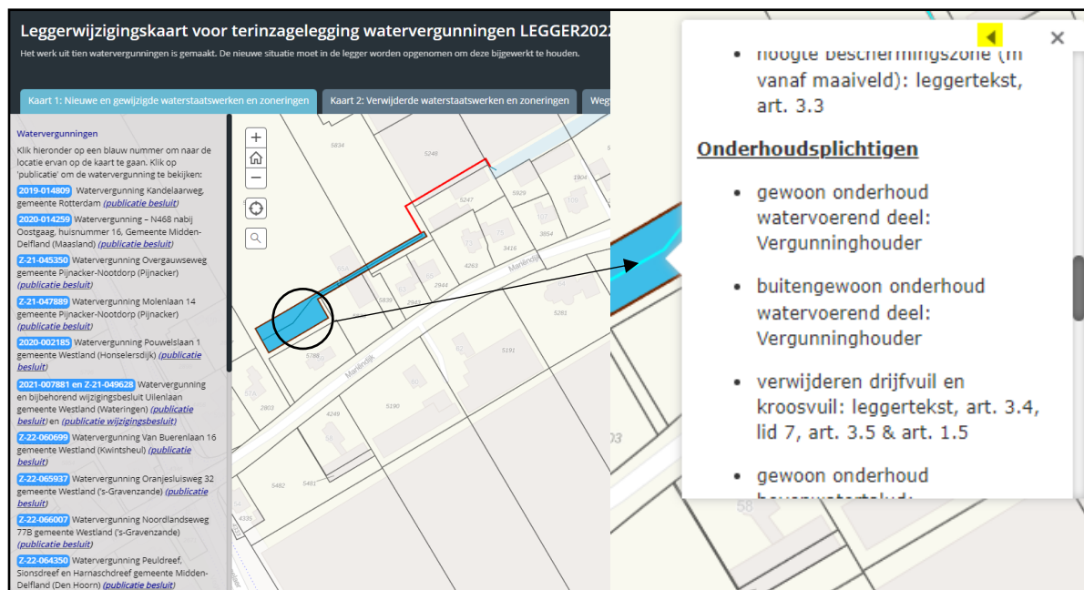
Figuur 1: Voorbeeld weergave van de interactieve leggerwijzigingskaart