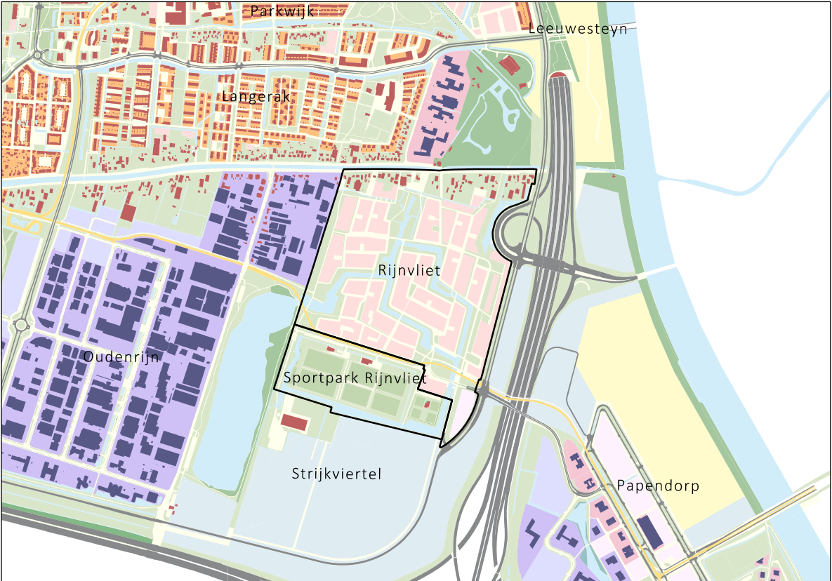
Rijnvliet en omgeving