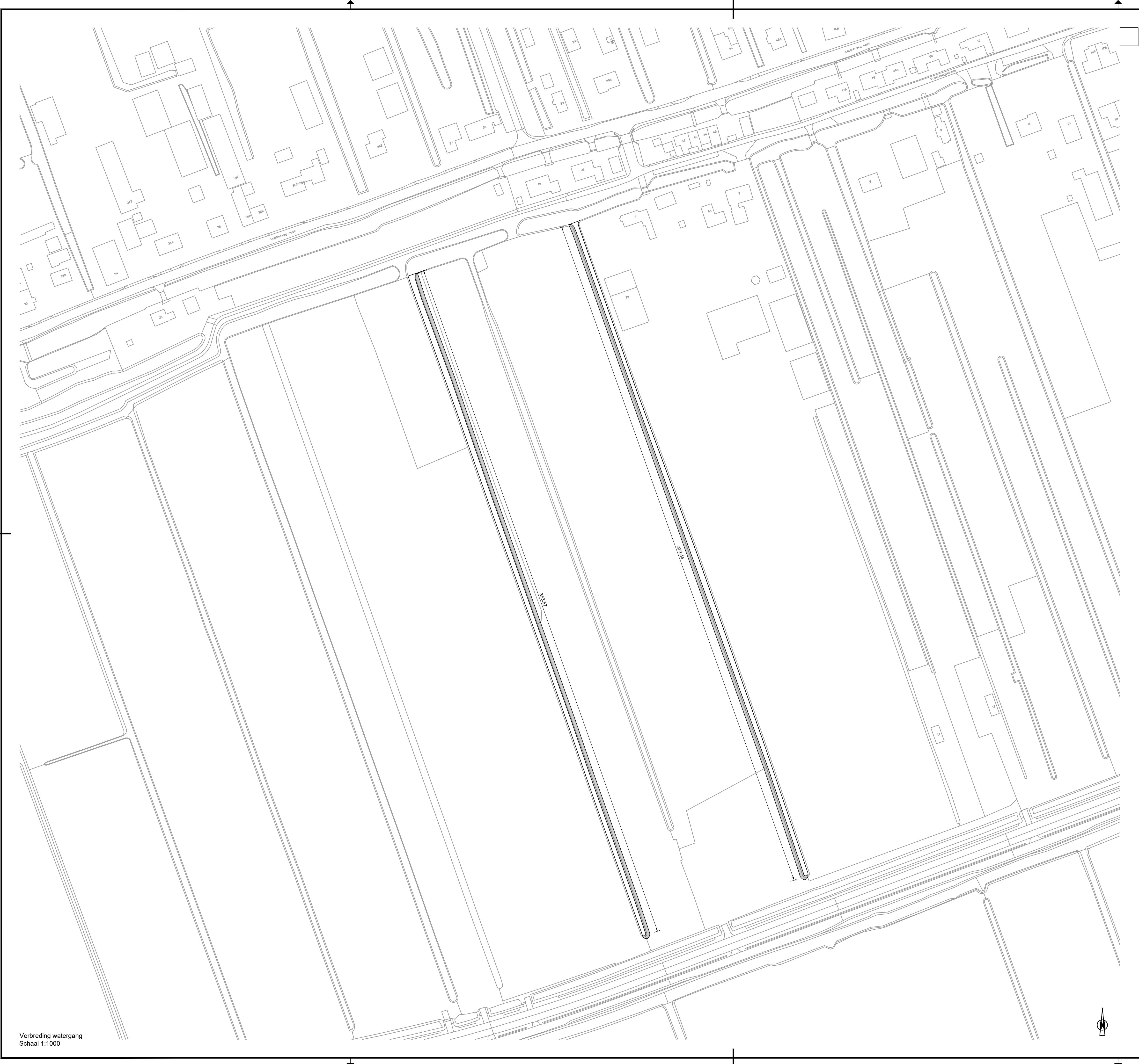
Verbreding watergang Schaal 1:1000