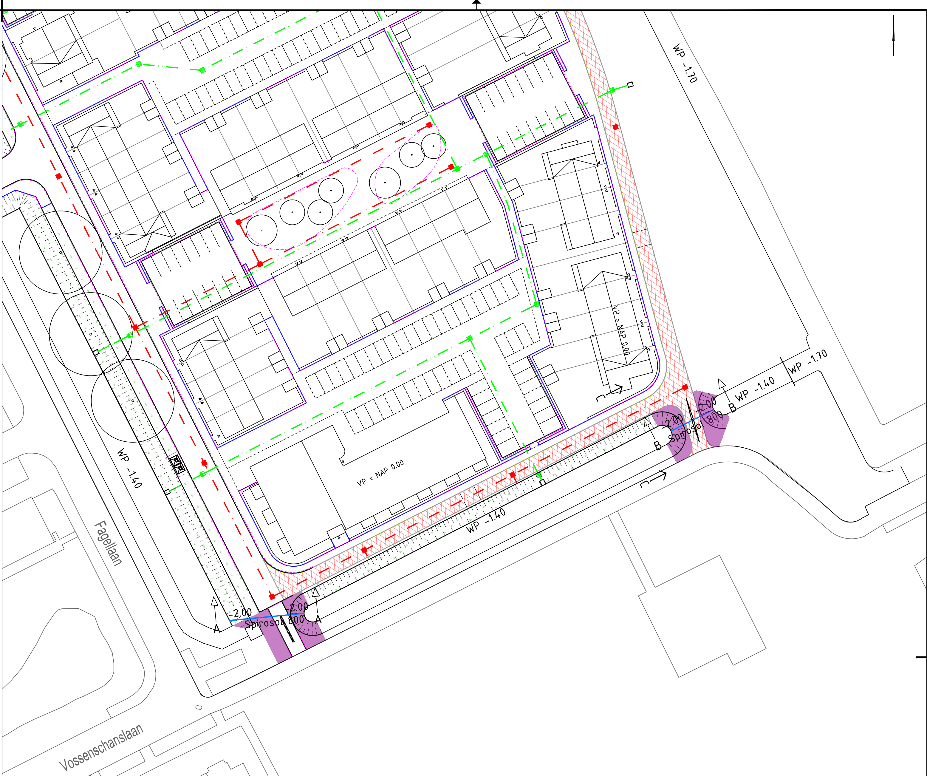
Situatie (1 : 500)