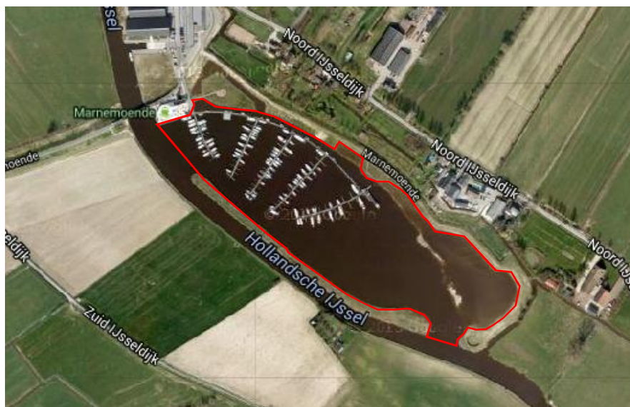
Figuur 1.1 Begrenzing bodembeheergebied plas Marnemoende

Voorliggende Nota bodembeheer heeft tot doel om bagger uit de Hollandsche IJssel waarin het arseengehalte licht verhoogd is lokaal toe te kunnen passen in plas Marnemoende. Het toepassen van bagger klasse B en bagger met verhoogd arseengehalte van elders is uitgesloten. Niet-gebiedseigen baggerspecie klasse A kan overigens wel gewoon toegepast worden. Hiervoor is geen Nota Bodembeheer nodig. In plas Marnemoende is dit overigens niet voorzien. Kostentechnisch is dit ook niet haalbaar. Nadat de bagger uit de Hollandsche IJssel is toegepast, zal de Nota bodembeheer worden ingetrokken.