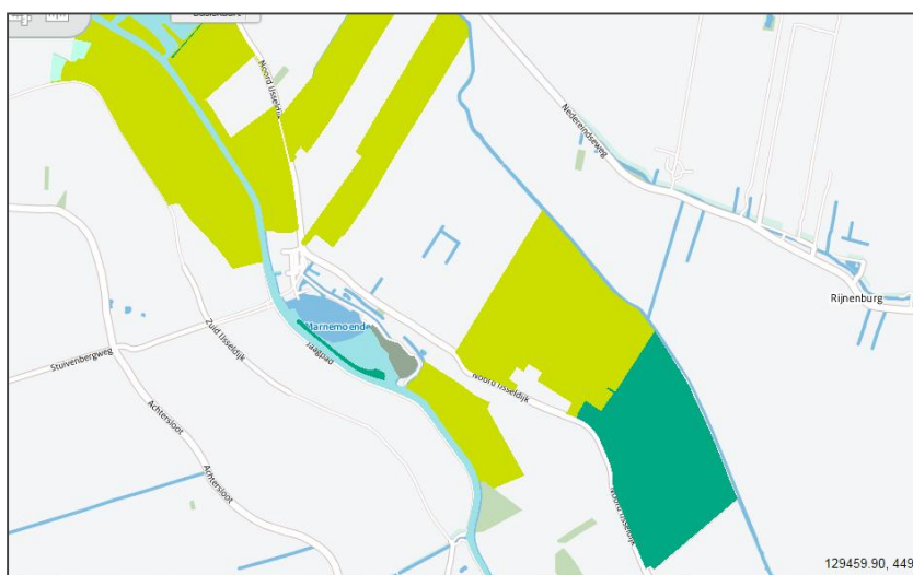
Figuur 2.4: Natuurbeheertypenkaart (provincie Utrecht, 2015)

lichtblauw = natuurbeheertype zoete plas