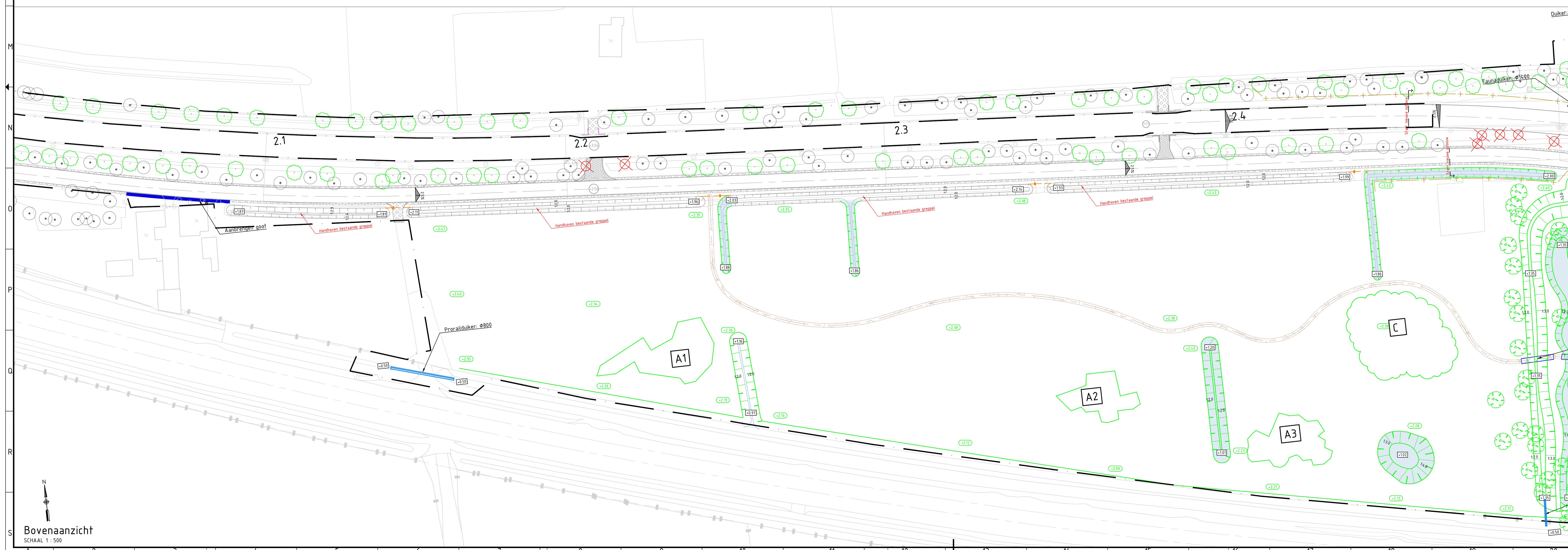
Bovenaanzicht SCHAAL 1 : 500