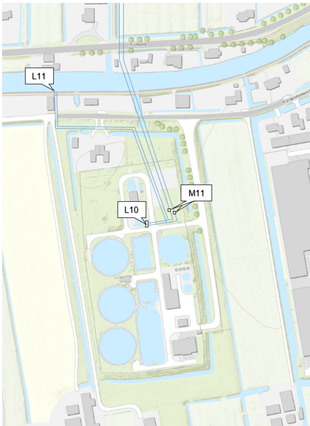
Kaart 2: Rioolwaterzuiveringsinstallatie Woerden