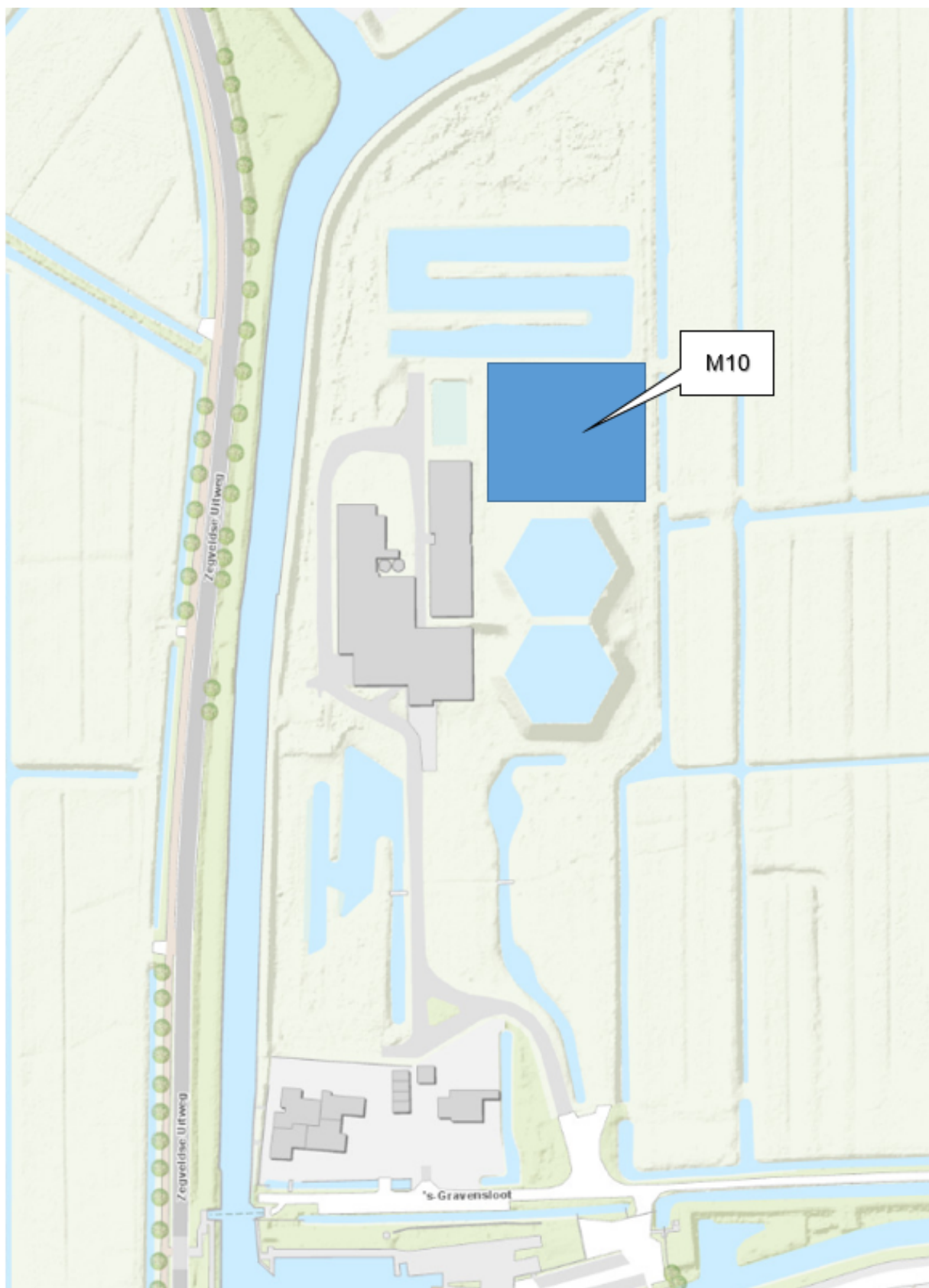
Kaart 1: Drinkwaterproductiebedrijf de Hooge Boom te Kamerik