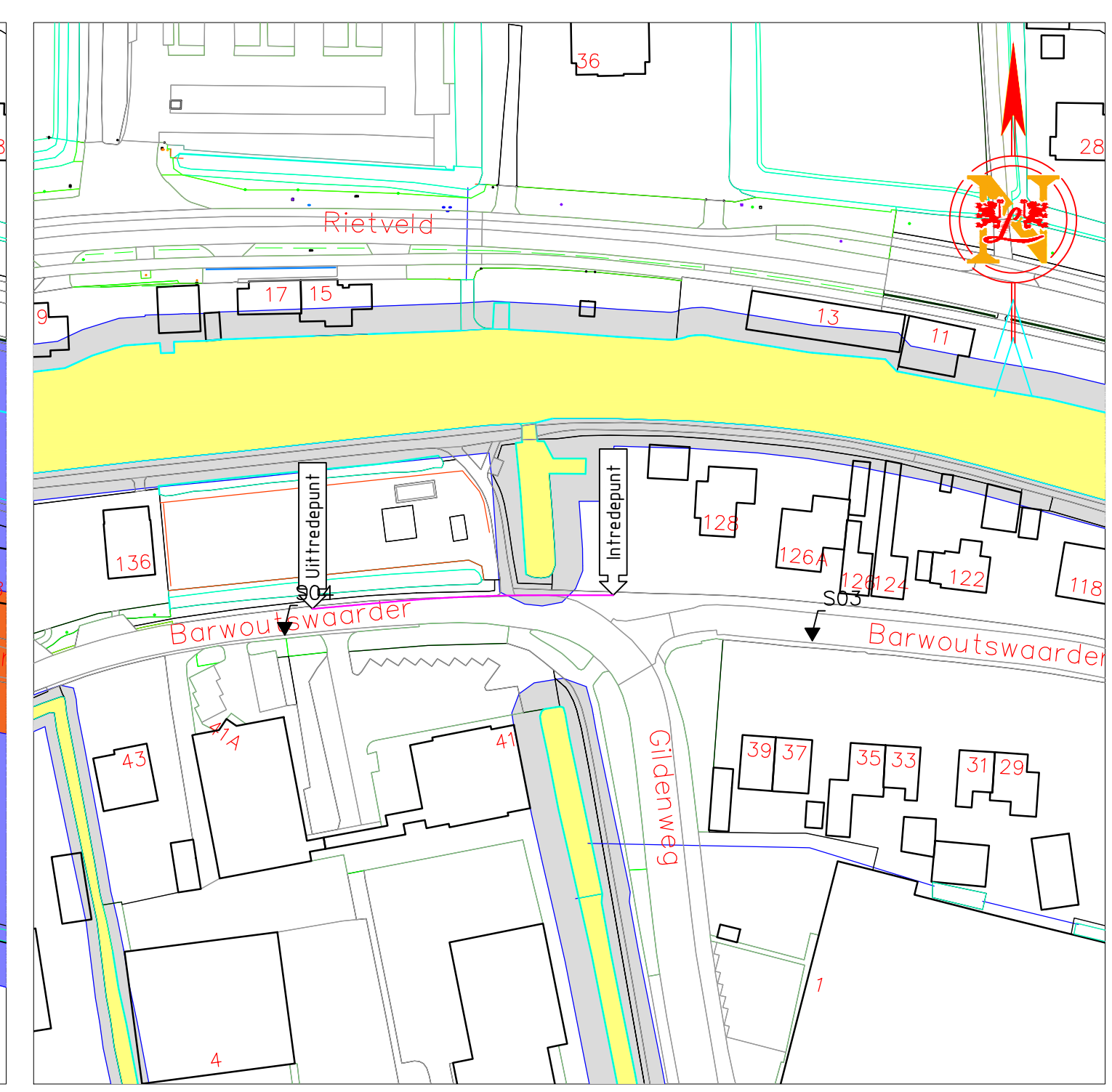
SITUATIE OPPERVLAKTEWATER SCHAAL 1:1000