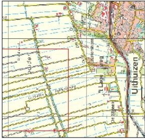
Overzicht schaal 1:50.000