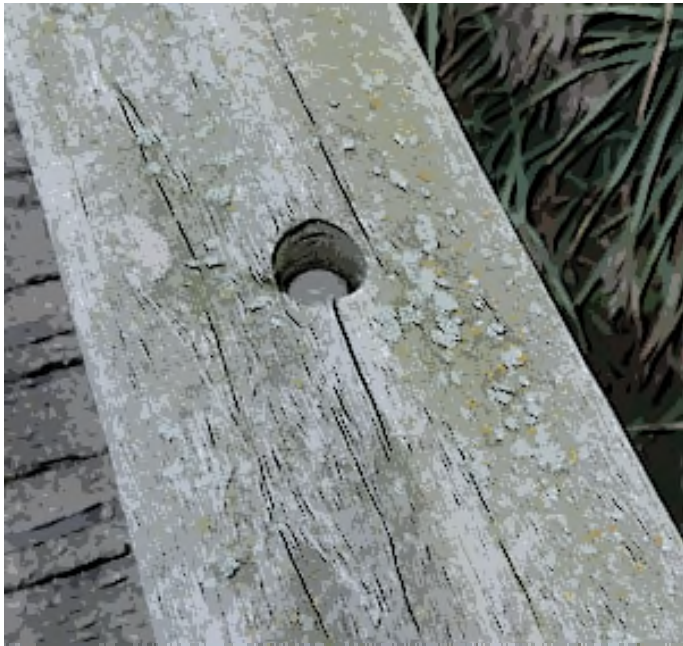
Detail: Bevestiging leuning aan paal.

Opdrachtgever: _____ Beukema Grondwerken BV Project: _____ Hoogholtje Onderdendam