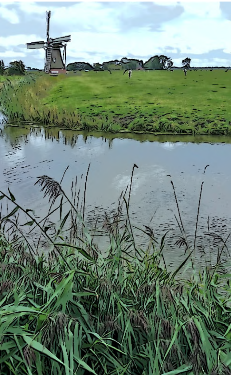
Positie 'Hoogholtje' t.o.v. de molen.