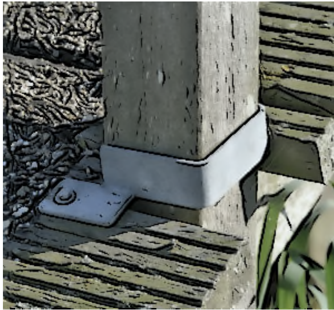
Detail: Bevestiging paal.