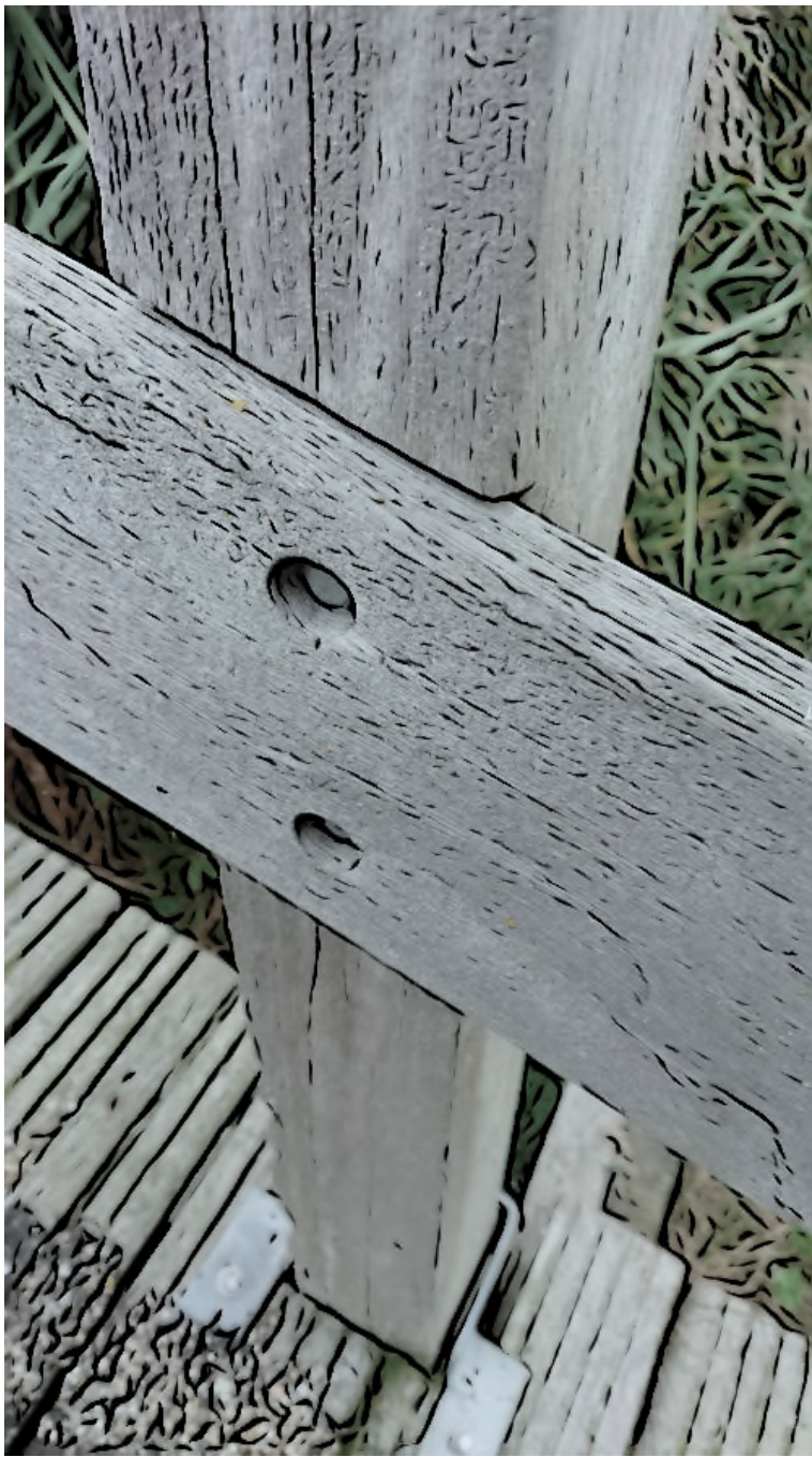
Detail: Bevestiging plank aan paal.