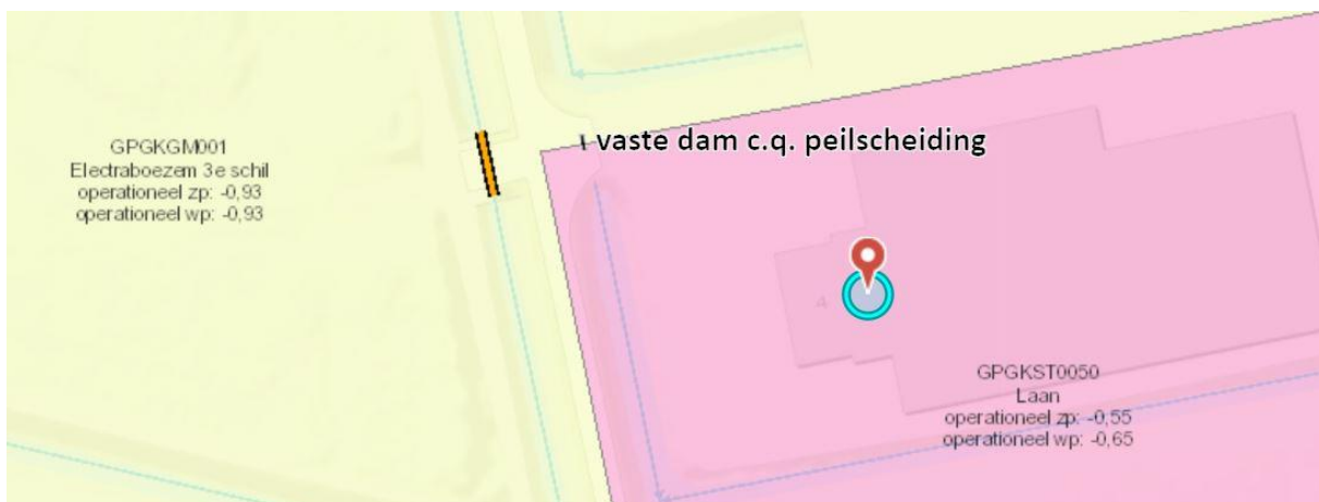
Figuur 2: Locatie vaste dam c.q. peilscheiding.

De vergunningaanvraag is bij waterschap Noorderzijlvest geregistreerd onder het zaaknummer Z/20/039937 en omvat de volgende voor het besluit relevante stukken: