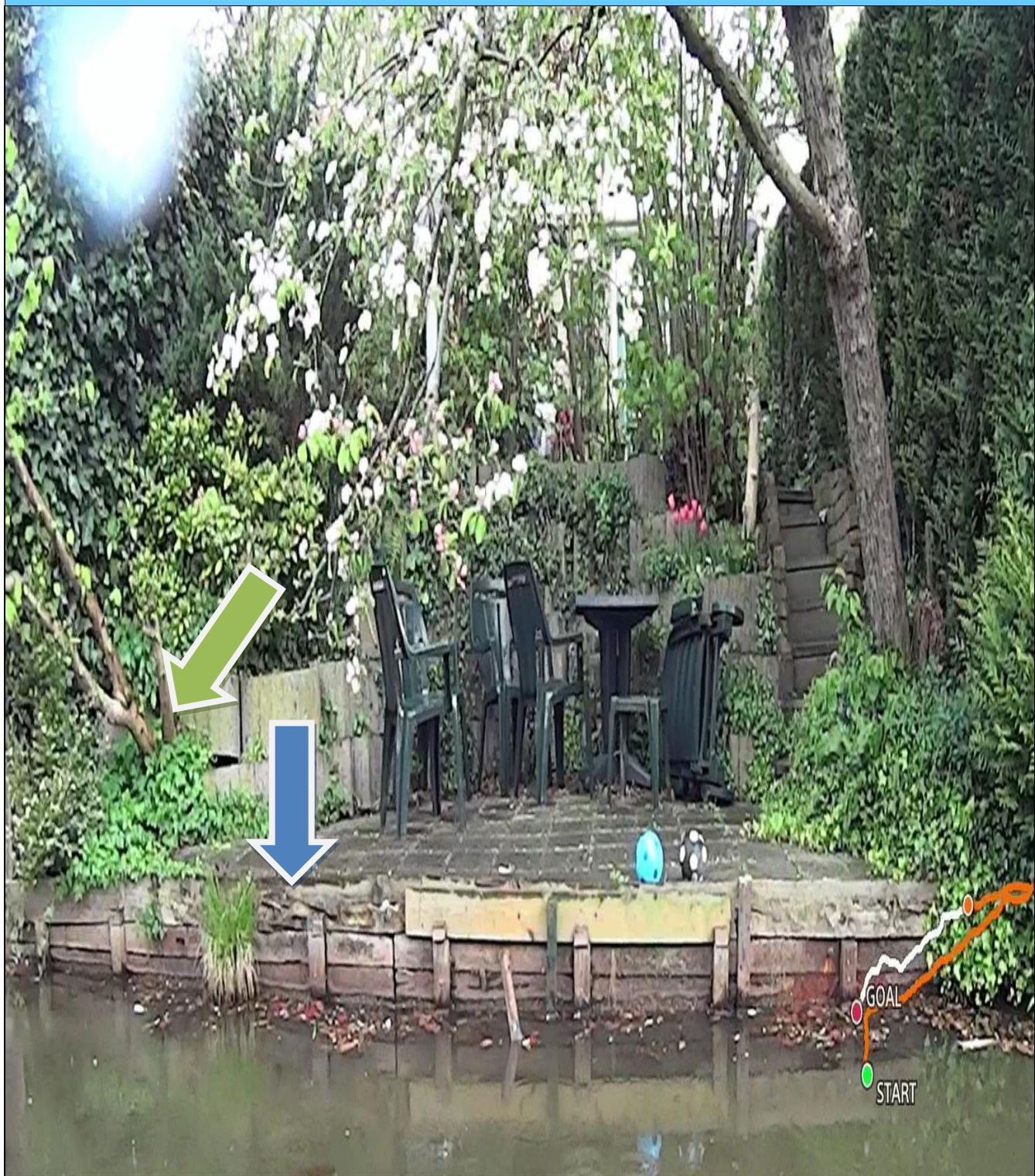
Foto behorende bij de vergunning voor het hebben en onderhouden van:

* een tuin (hieronder wordt verstaan: beplanting/bomen) tot aan de insteek van een a-water zonder bouwwerken; in de beschermingszone van het a-water met leggercode OVK08597 op het perceel kadastraal bekend als gemeente Breda, sectie H, nummer 5807.