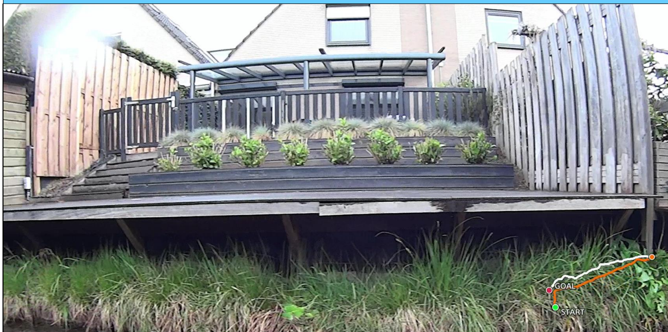
Foto behorende bij de vergunning voor het hebben en onderhouden van: