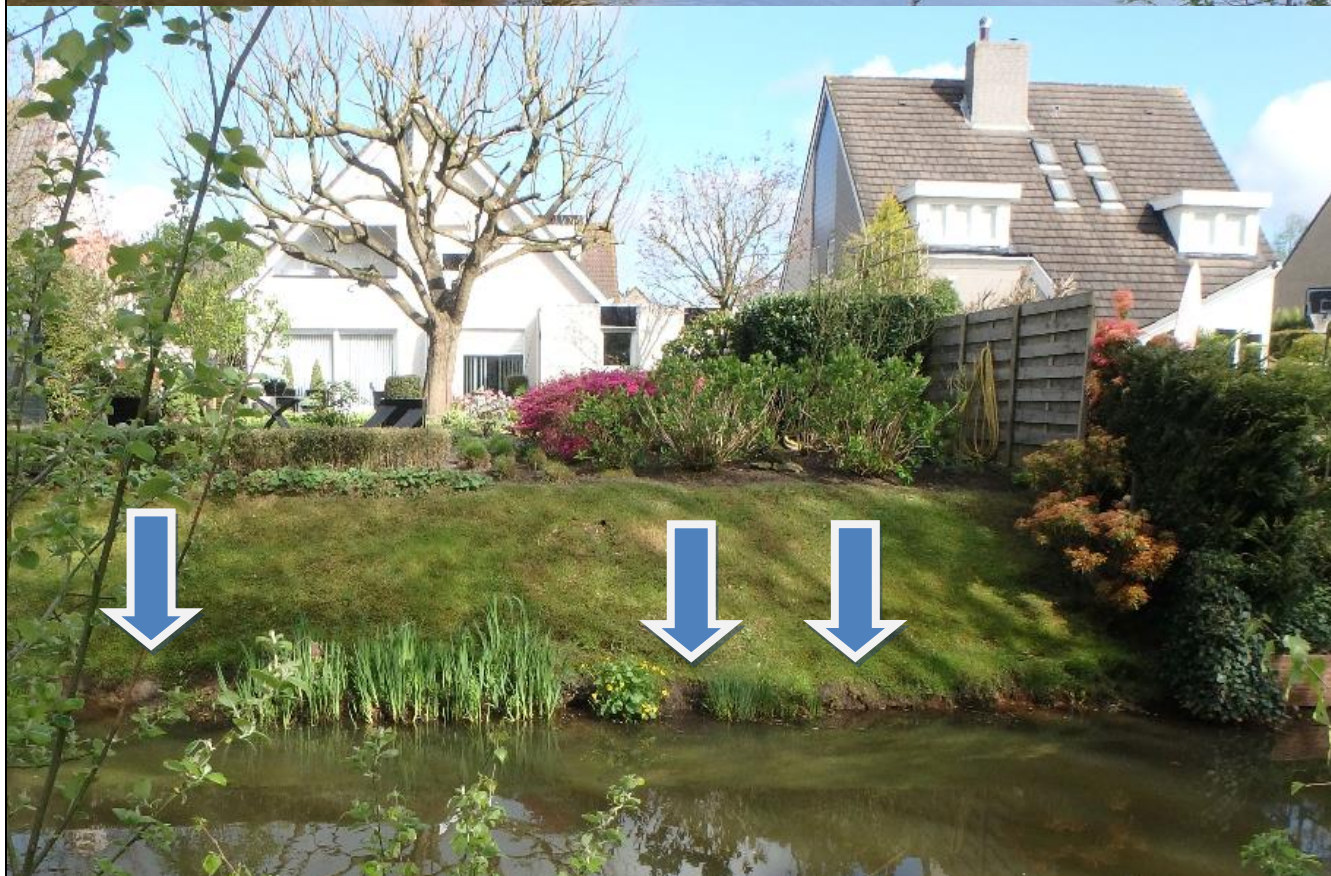
Foto behorende bij de vergunning voor het hebben en onderhouden van: