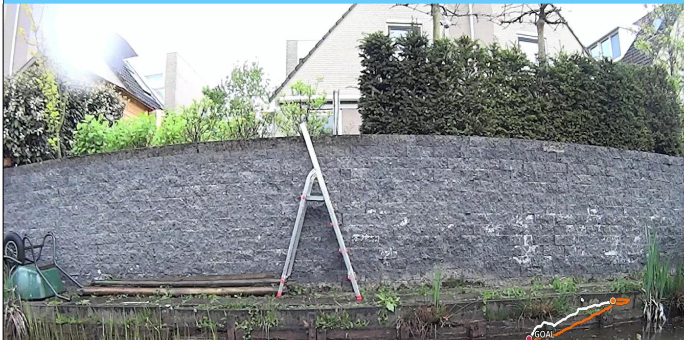
Foto behorende bij de vergunning voor het hebben en onderhouden van: