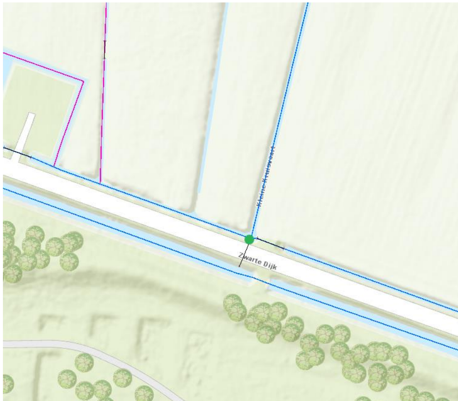
Figuur 1: Groene stip schematische weergave locatie nieuw te plaatsen afsluiter