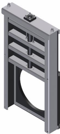
Figuur 3: Voorbeeld spindelafluiser, weergegeven zonder inschuif montagedeel

Duiker KDU16777 heeft een diameter van 0,7 meter en dient te worden afgesloten met een spindelafluiser met een ronde doorlaat en geschikt voor montage direct in een bestaande duiker, zoals op figuur 3. De spindelafluiser dient ten noorden van de Zwarte Dijk geplaatst te worden, zie bijlage, figuur 1.