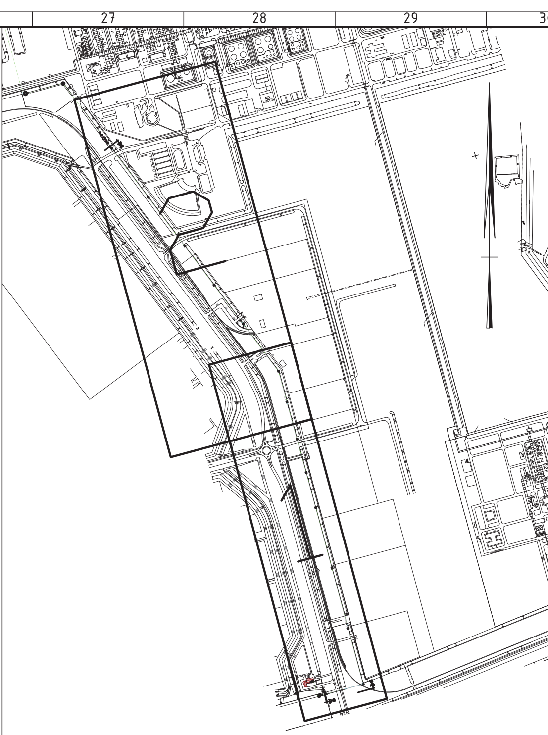
Situatie overzicht SCHAAAL 1 : 10.000