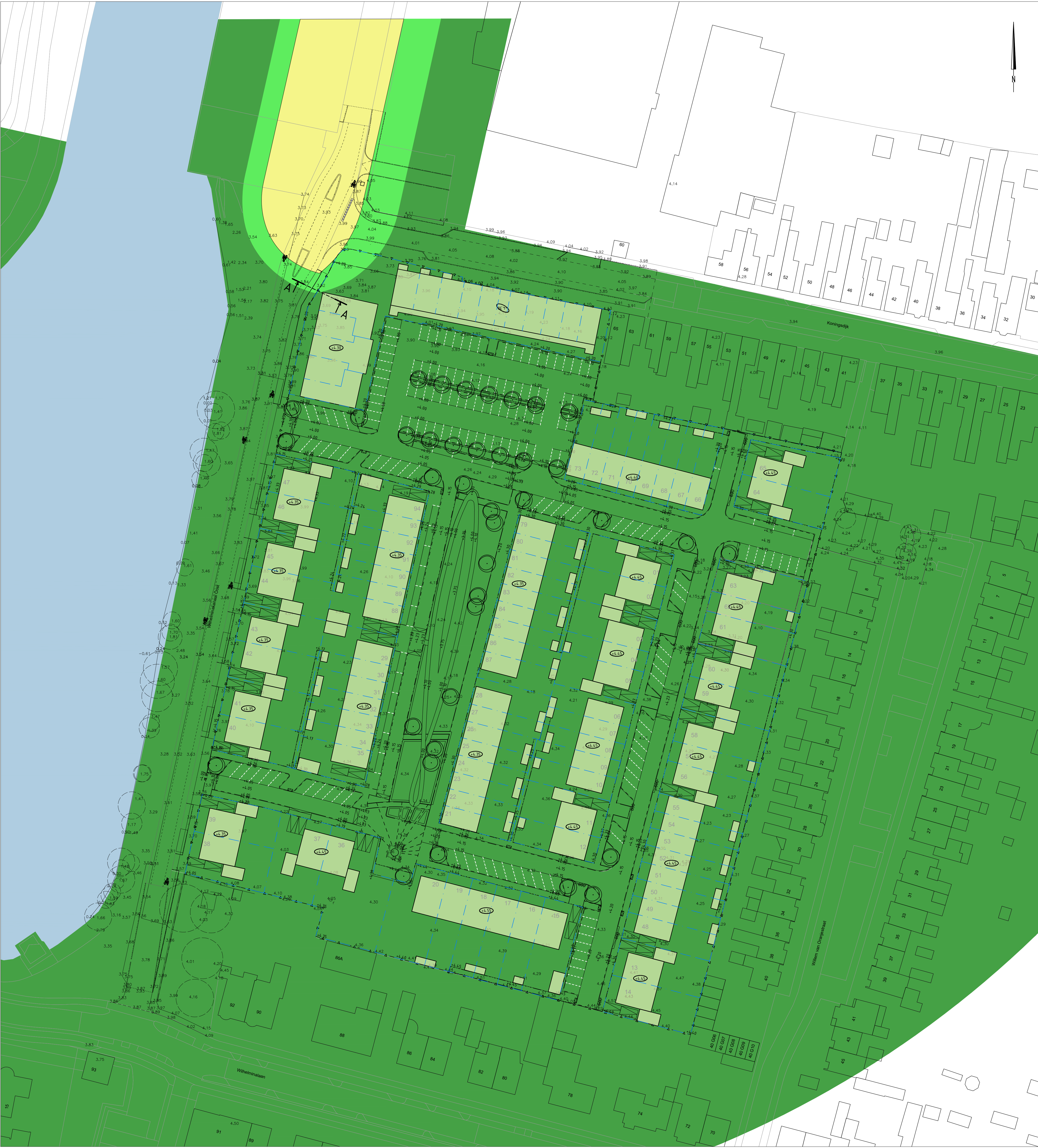
Gehele plangebied Schaal 1:500