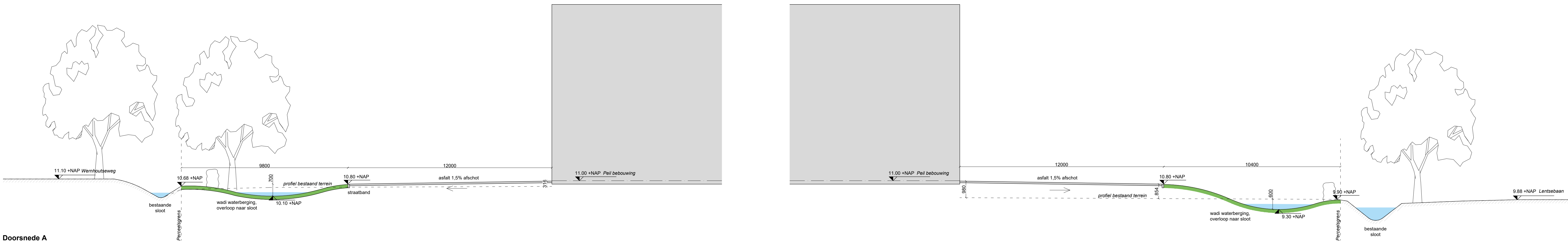
Doorsnede A schaal 1:100