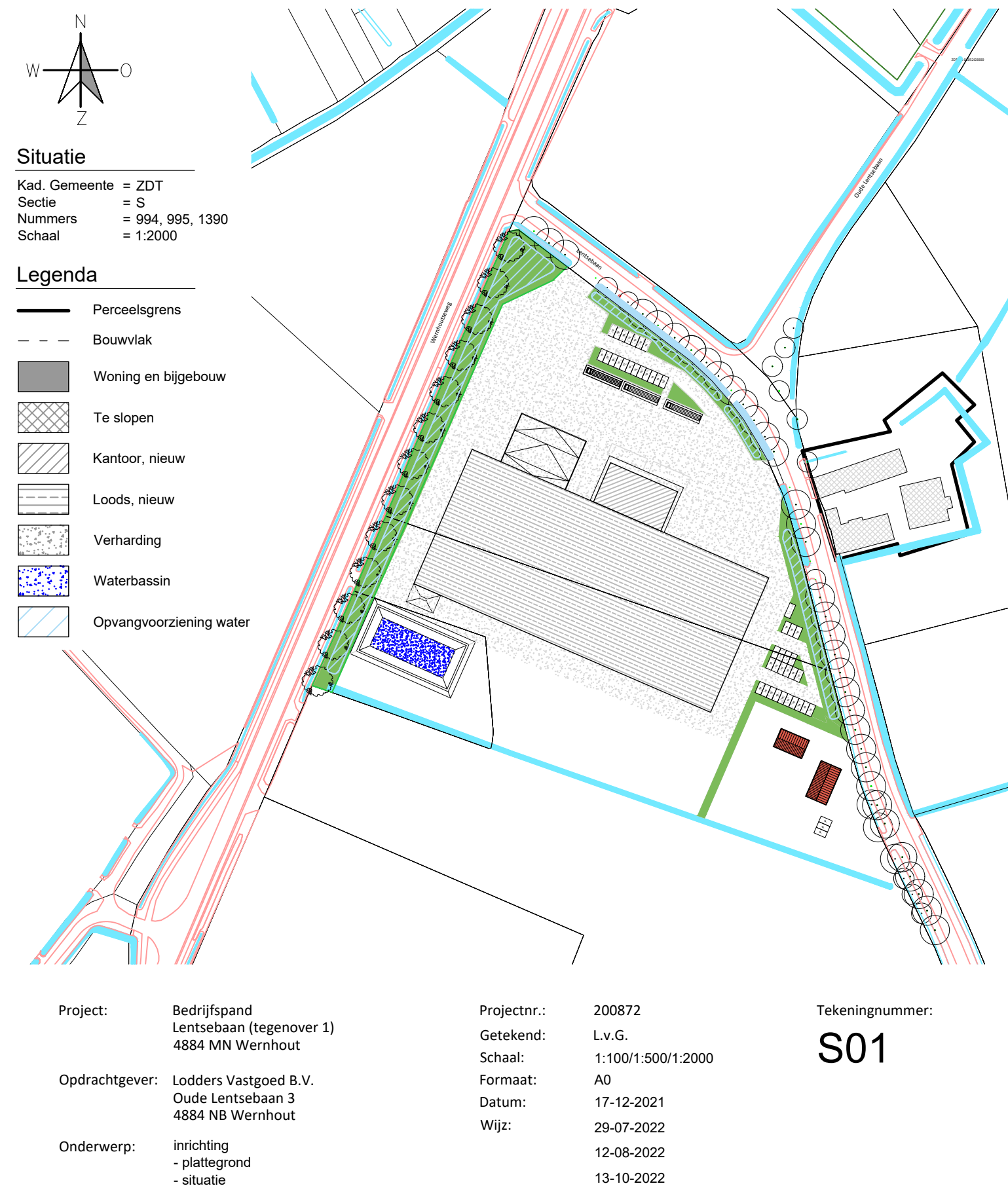
Situatie Kad. Gemeente = 201 Sedie = S Nummers = 984, 995, 1390 Schaal = 1:2000