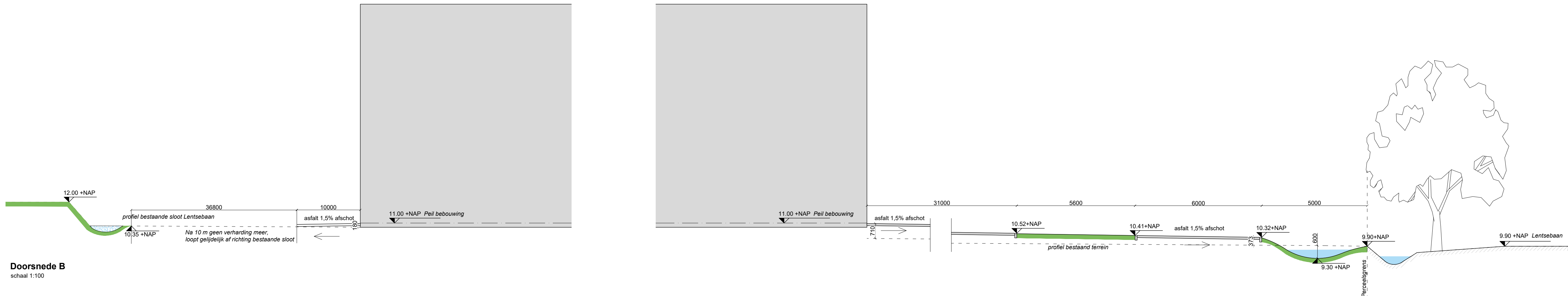
Doorsnede B schaal 1:100