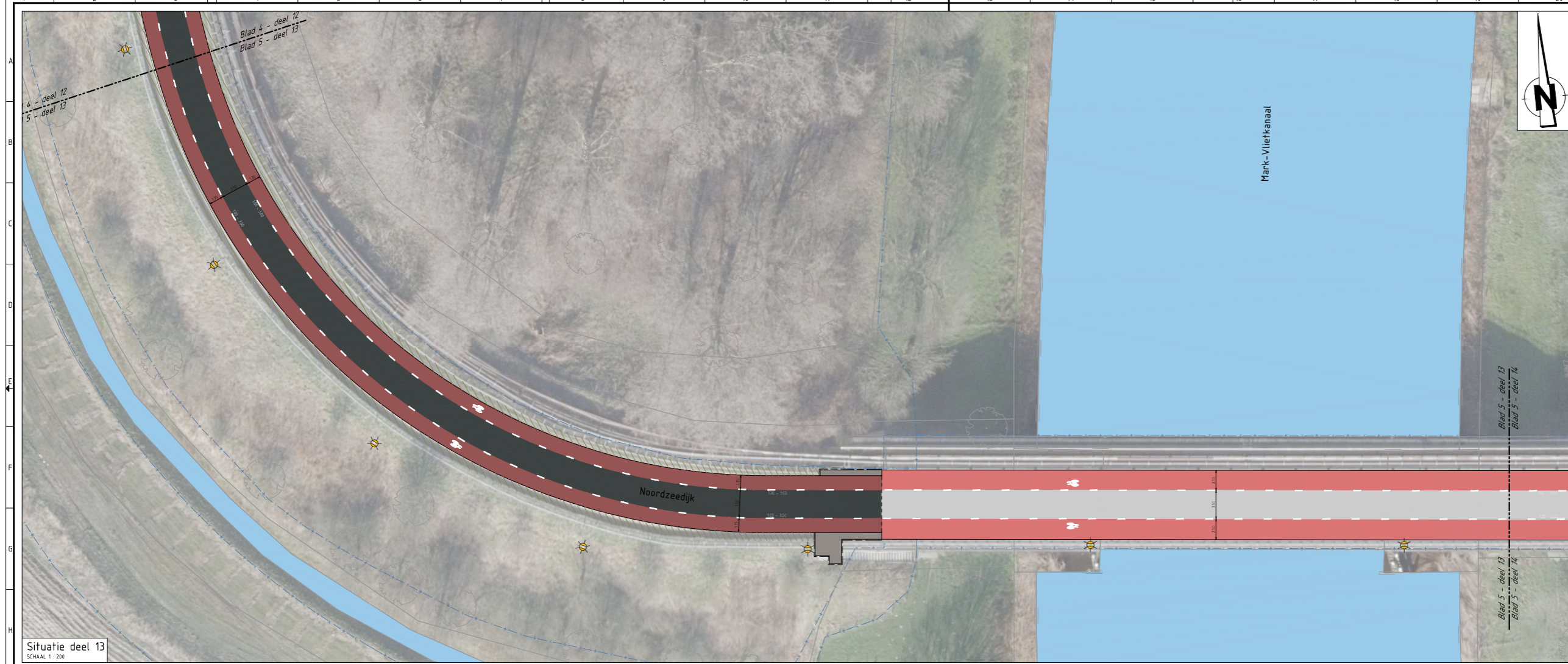
Situatie deel 13 SCHAAL 1 : 200