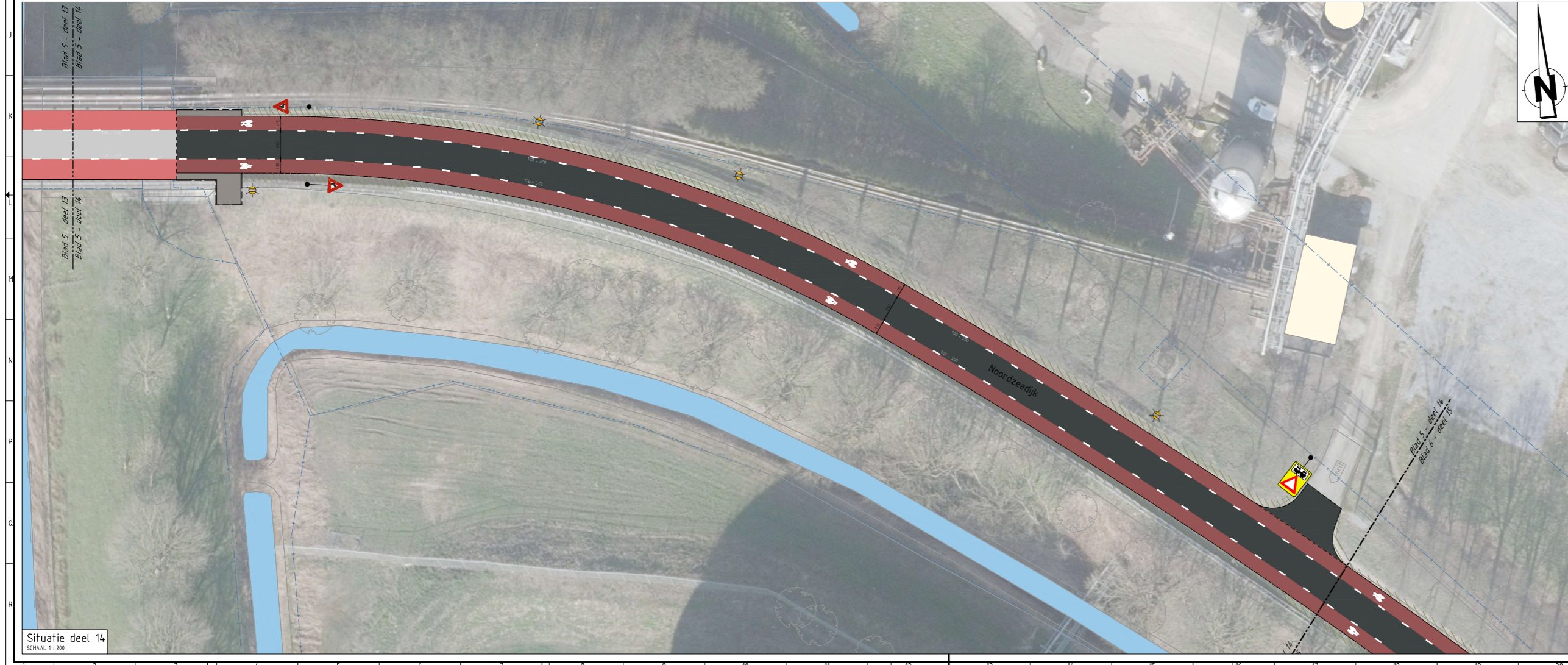
Situatie deel 14 SCHAAL 1 : 200