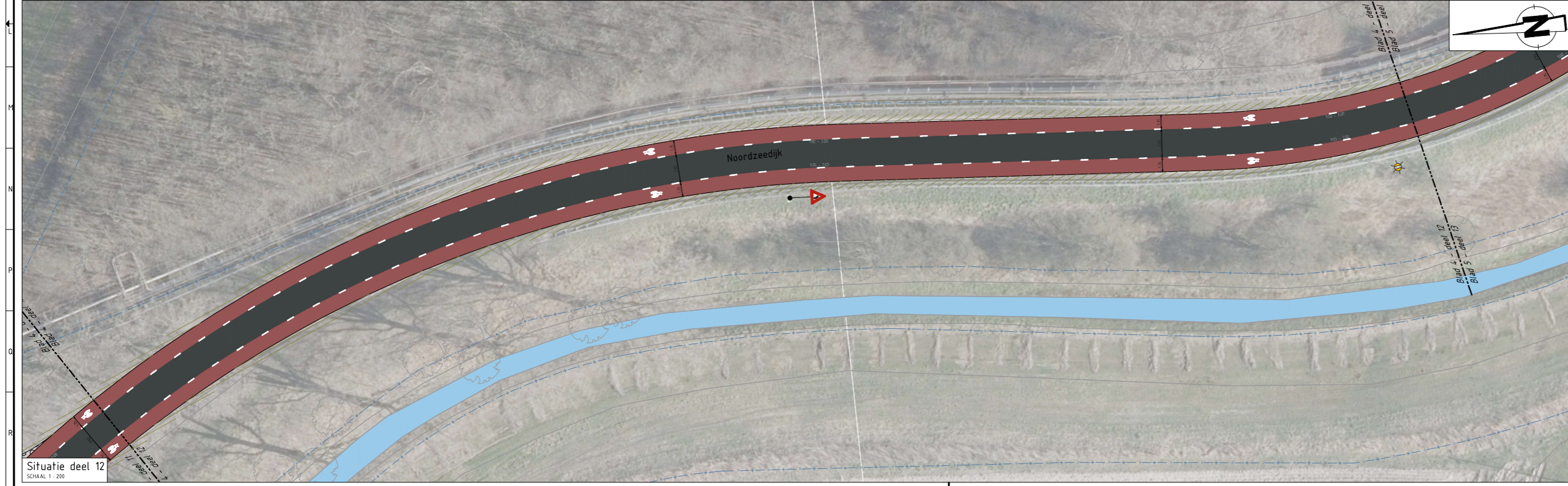
Situatie deel 12