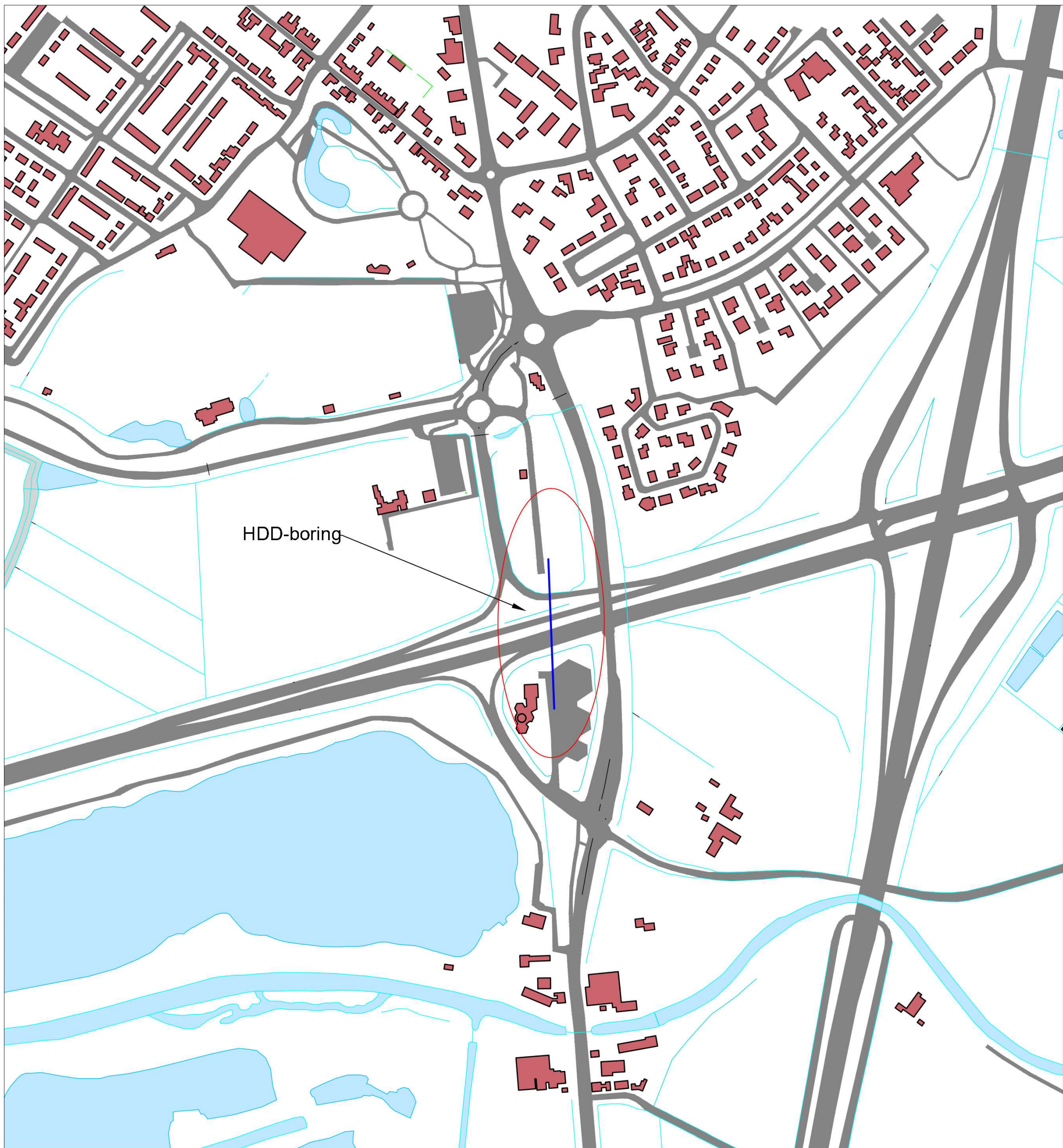
Situatieschets (schaal 1:4000)