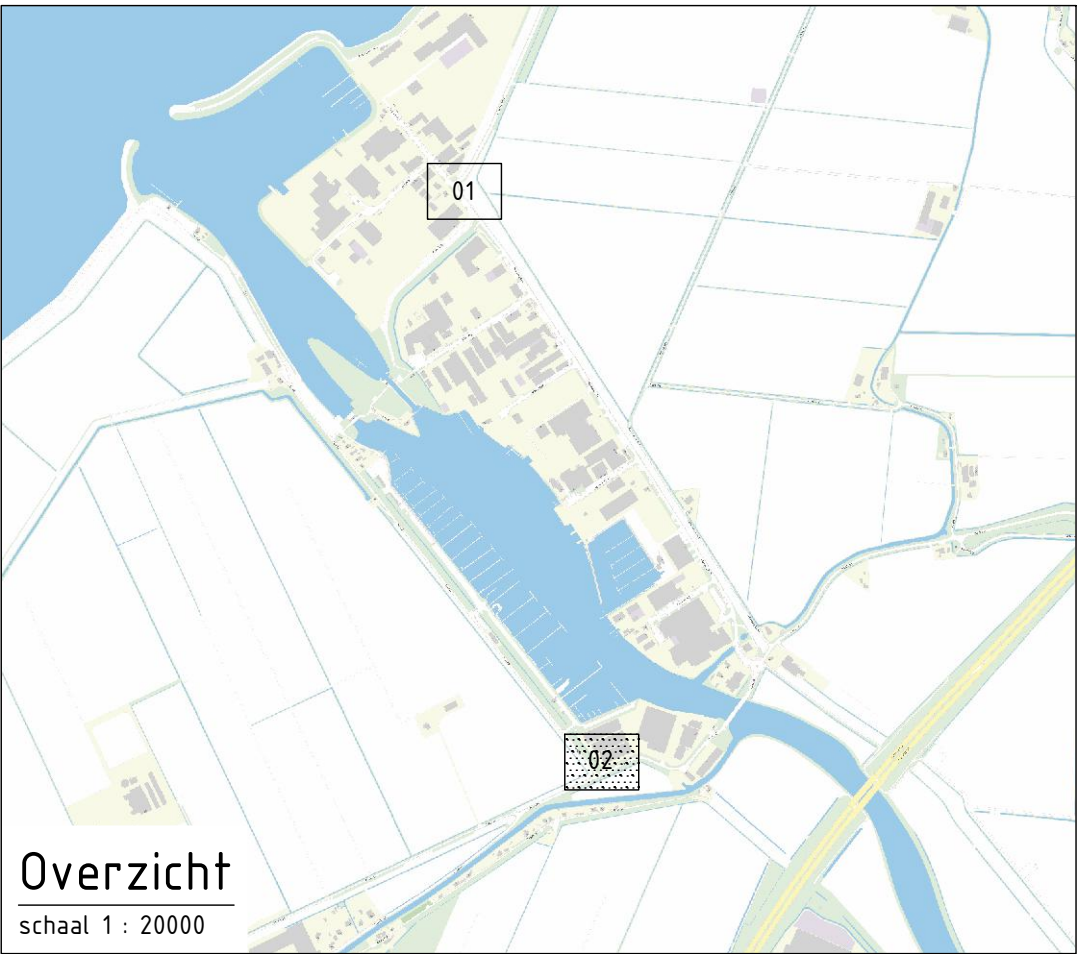
Overzicht schaal 1 : 20000