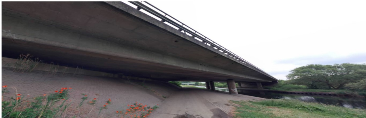
Overzicht onderzijde (zuid)