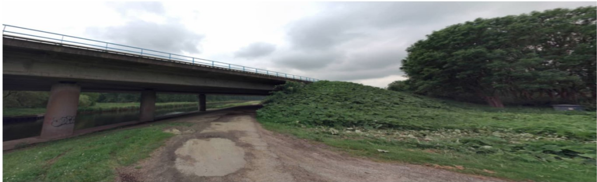
Overzicht onderzijde (noord)