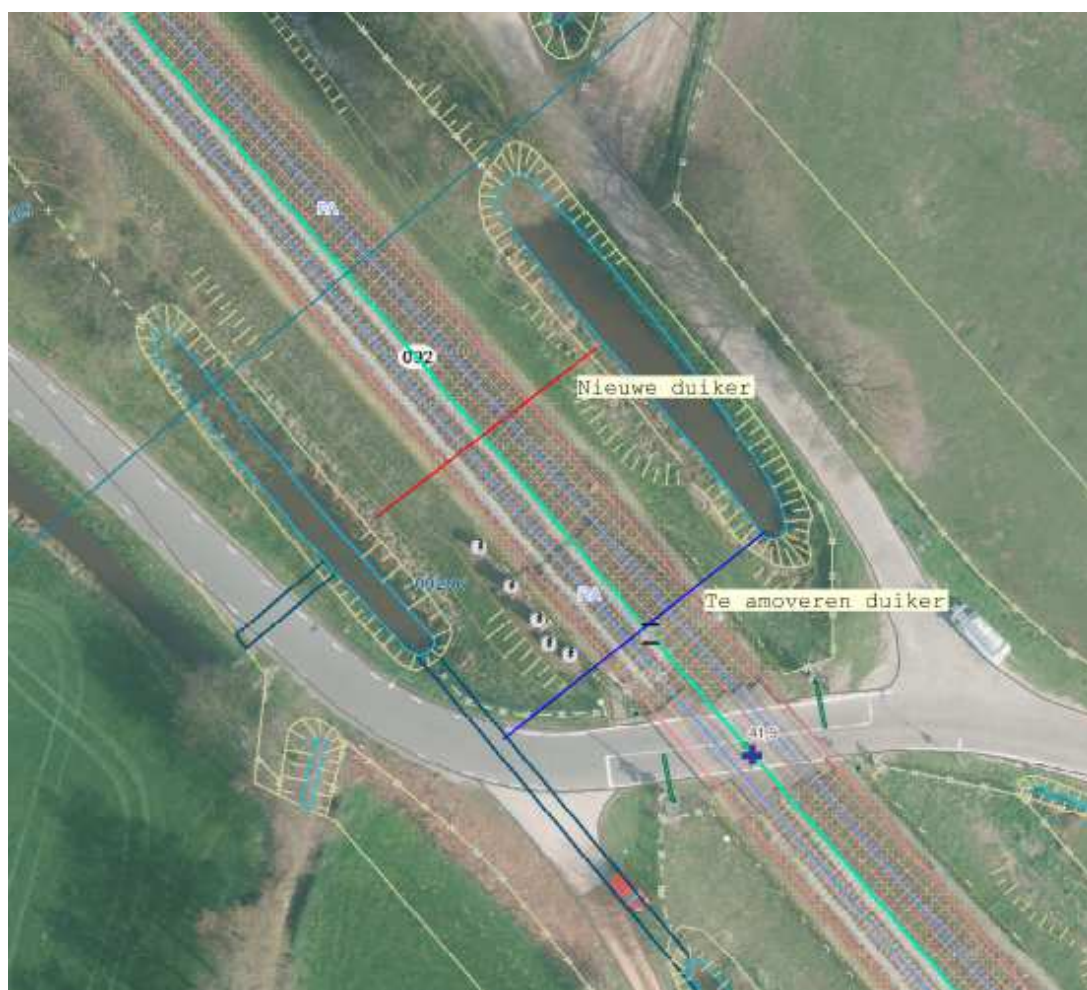
locatie B: Peter van den Breemerweg