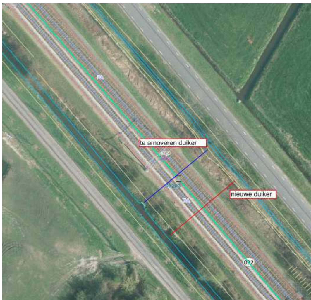
locatie C: Hooiweg – A.P. Hilhorstweg