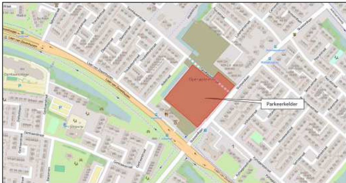
Figuur 2 - Te bemalen kelder

Oppervlaktewaterlichaam waarop wordt geloosd (Sloot Tannhauserstraat):