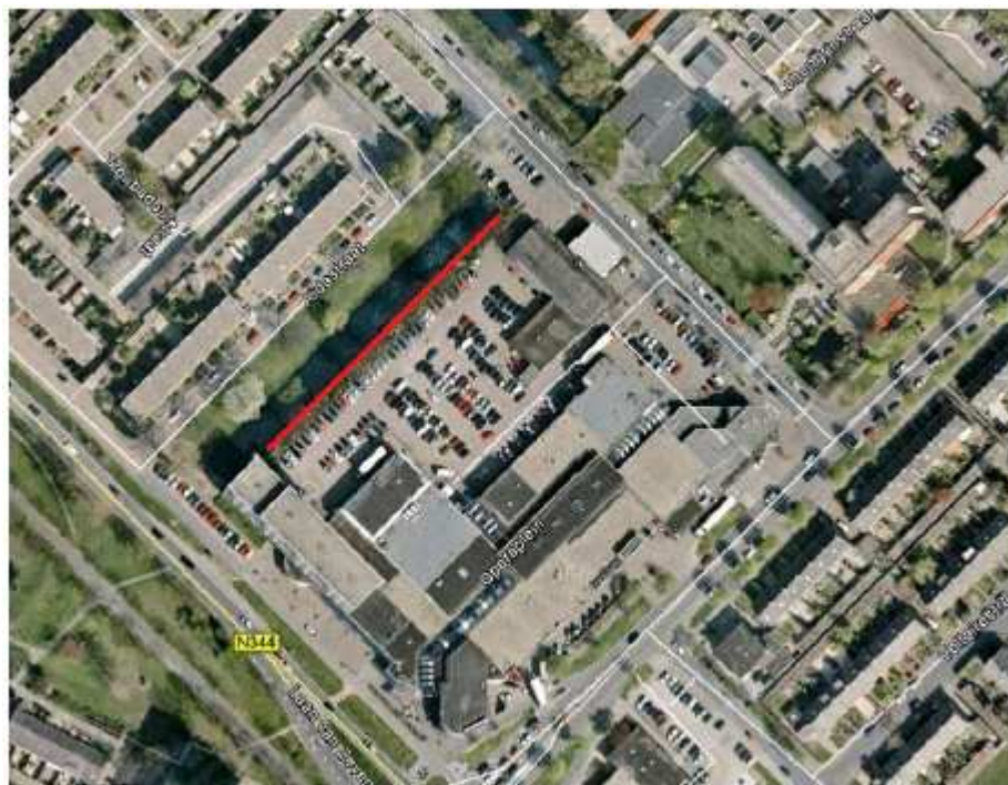
Afbeelding 6-1: Watergang waarop het bemalingswater wordt geloosd

Oppervlaktewaterlichaam waarop wordt geloosd (Sloot Tannhauserstraat):