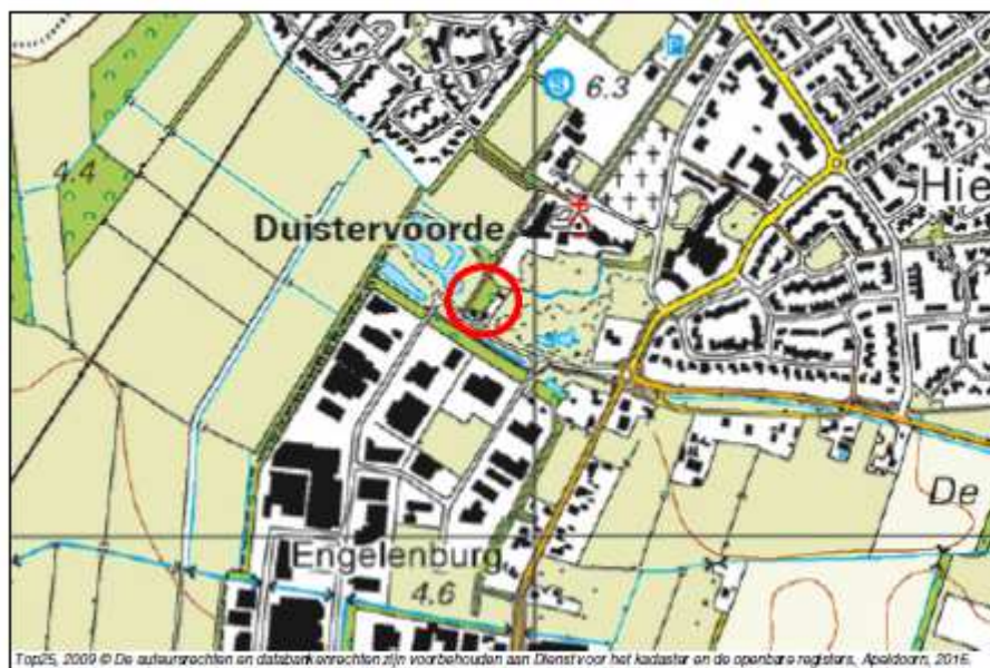
Figuur 1-1: Ligging werklocatie