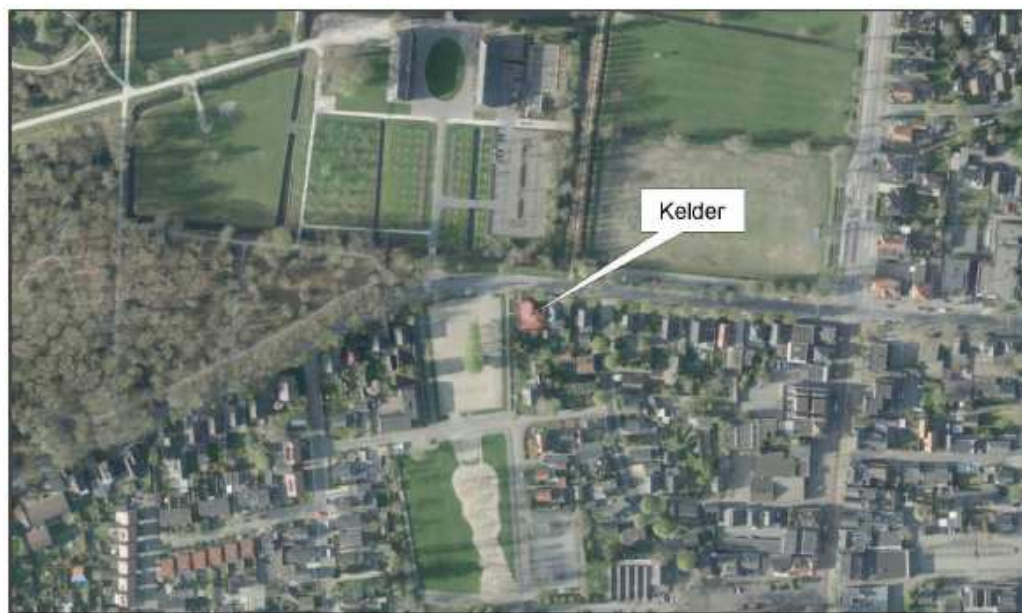
Figuur 2 - Projectlocatie ingezoomd