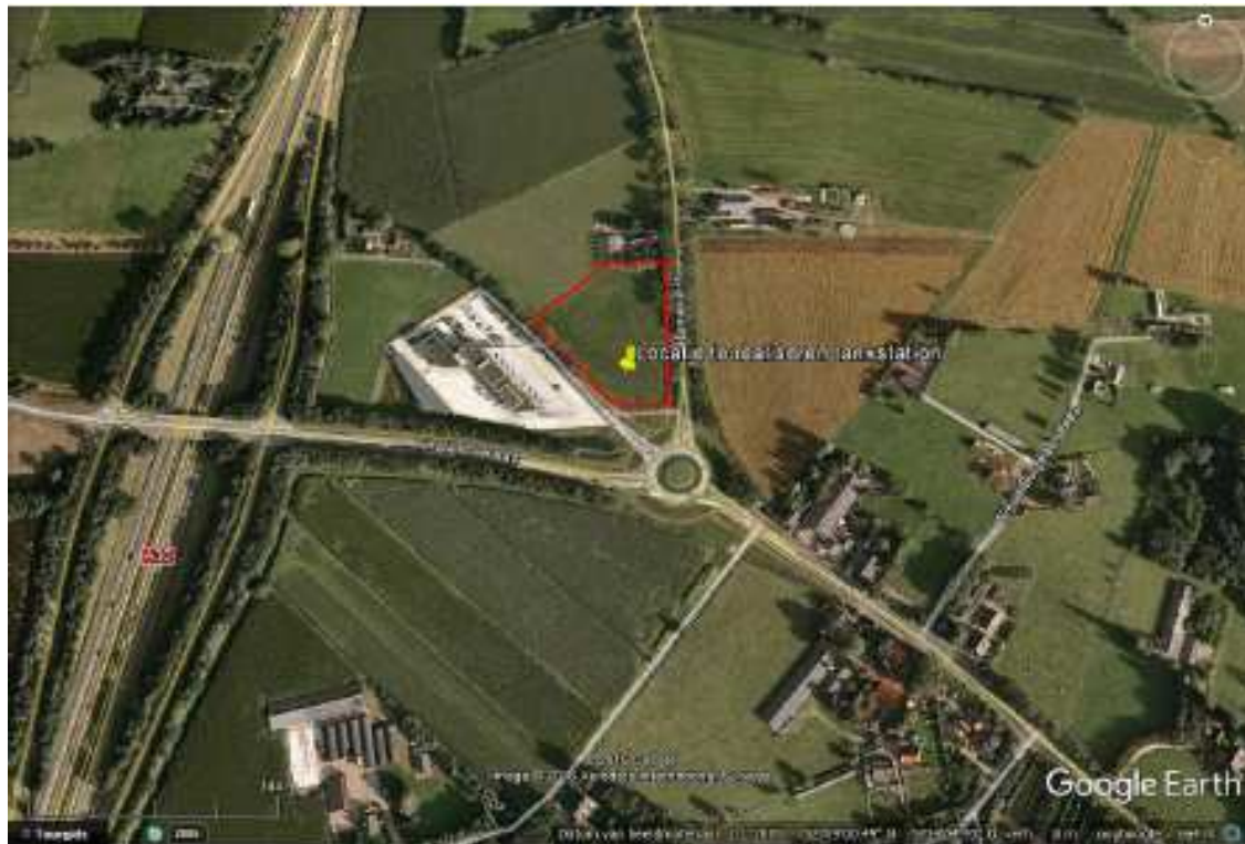
Figuur 1: Situering te realiseren tankstation