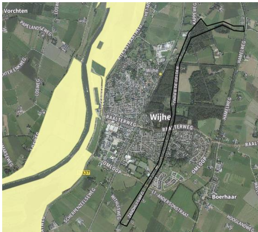
Kaart Natuurnetwerk Nederland

De projectgebied ligt op ongeveer 1 km van gronden die deel uitmaken van het Natuurnetwerk Nederland. De werkzaamheden zullen alleen vlak naast de Zandwetering plaatsvinden. Dit zorgt er voor dat de bestemming en doelen van de aanliggende gronden niet veranderen.