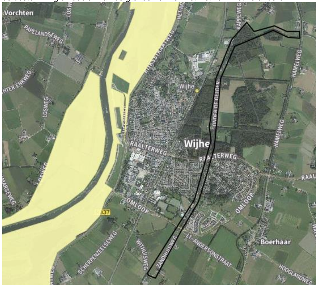
Kaart Natuurnetwerk Nederland

De projectgebied ligt op enige afstand van gronden die deel uitmaken van het Natuurnetwerk Nederland. De werkzaamheden zullen alleen rond de Zandwetering plaatsvinden. Dit zorgt er voor dat de bestemming en doelen van de gronden binnen het Netwerk niet veranderen.