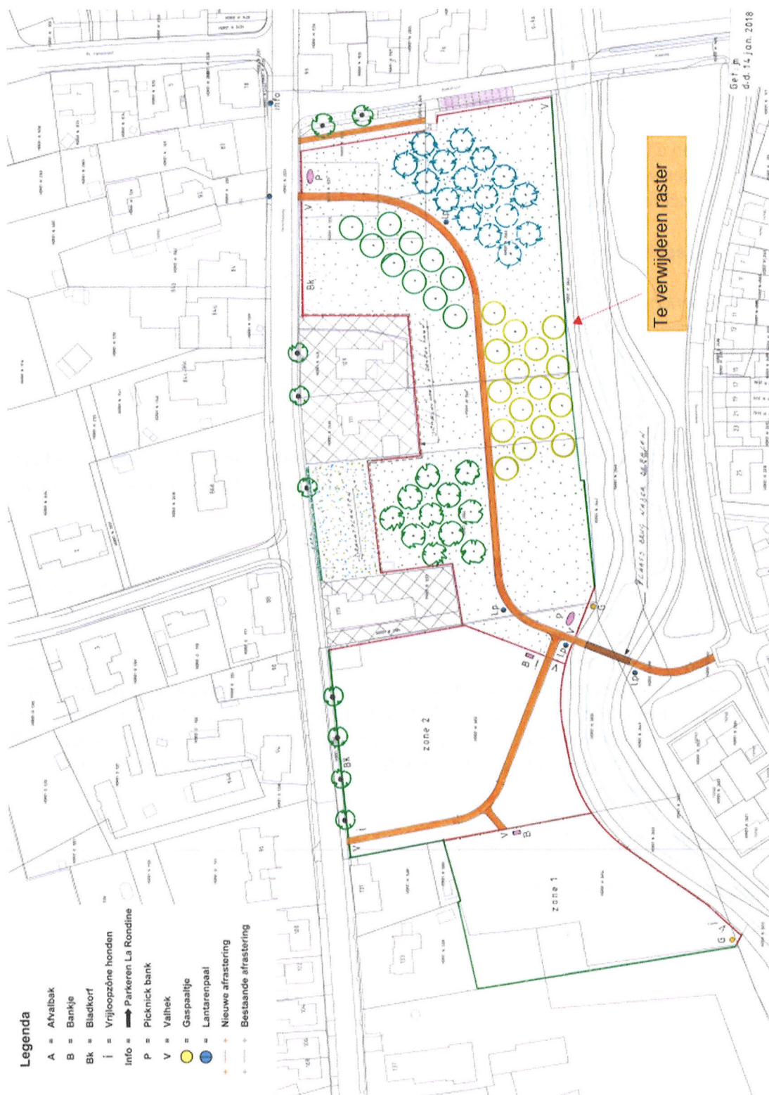
Bijlage 1 Tekening "rasters", d.d. 14 jan. 2018.