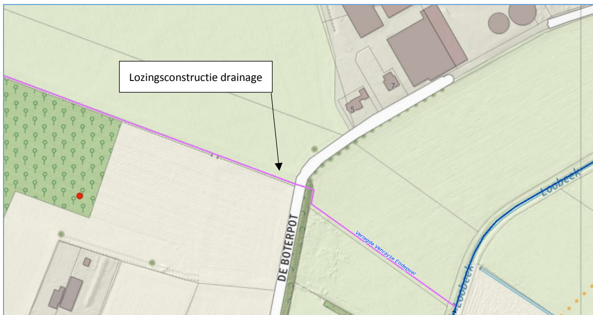
Afbeelding 2: locatie lozingsconstructie drainage

De aangelegde drainage kan bij droogte eveneens gebruikt worden als (sub)irrigatie. De benodigde hoeveelheid water wordt onttrokken uit de primaire watergang Afleidingskanaal. Op onderstaande afbeelding is de locatie van het onttrekkingspunt aangegeven.