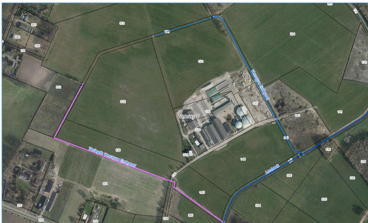
Afbeelding 1 : nieuwe situatie met de gedempte Venrayse Endepoel (blauw) en de nieuw gegraven verlegde Venrayse Endepoel (violet)

De nieuwe waterloop krijgt voor het volledige tracé de status primaire waterloop. De onderhoudsplichtige van de 'Verlegde Venrayse Endepoel' wordt Waterschap Limburg.