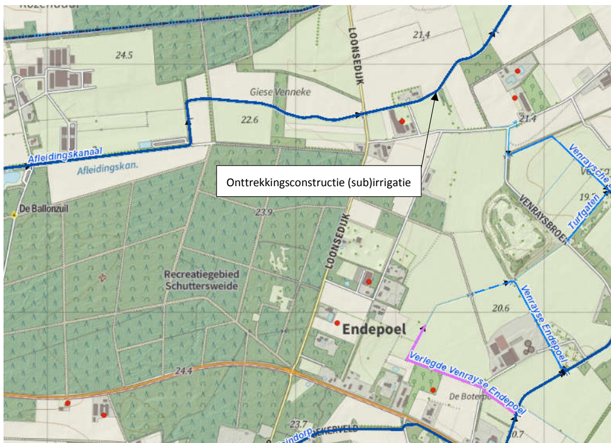
Abbeelding 3: locatie onttrekkingsconstructie (sub)irrigatie

Het beheer en onderhoud van de objecten in de nieuwe situatie wordt in de legger als volgt aangeduid: