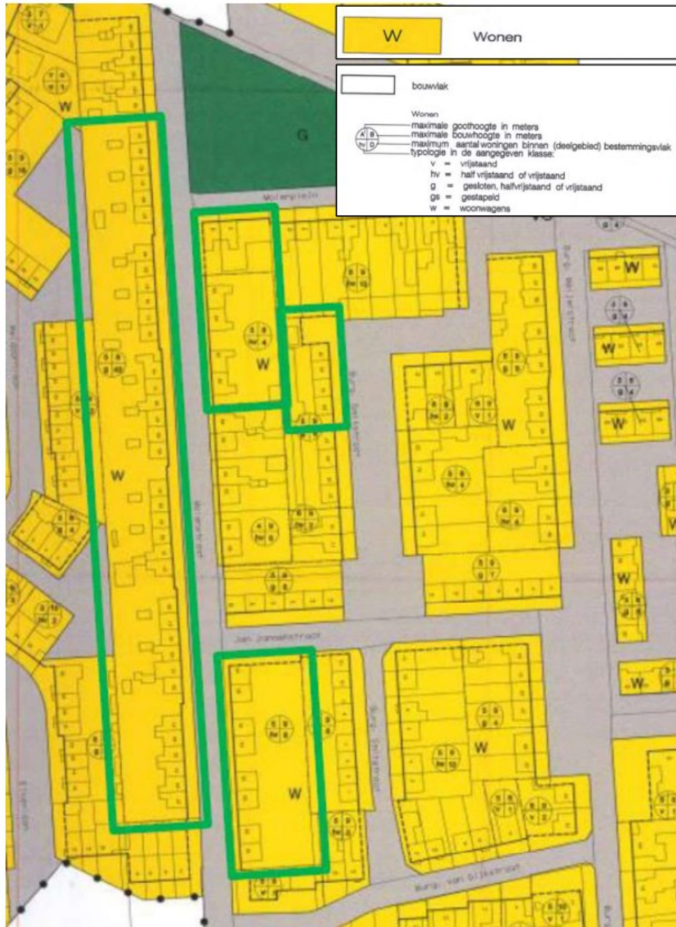
Uitsnede vigerende beheersverordening (Ruimtelijkeplannen.nl, 2021)