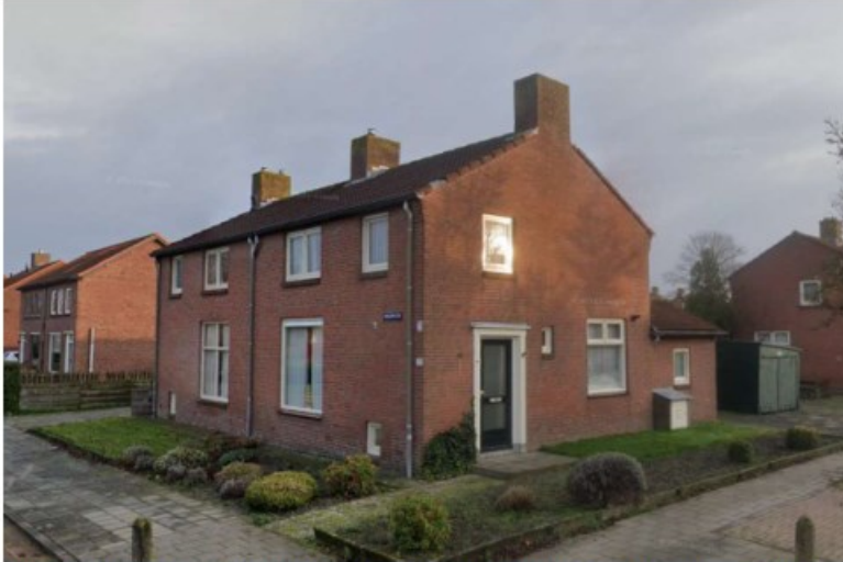
Twee-onder-een-kapwoningen Molenplein 18 en 20 (google Street view, 2021)