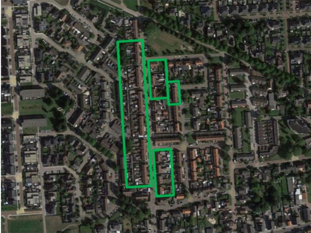
Plangebied (Casade, 2021)