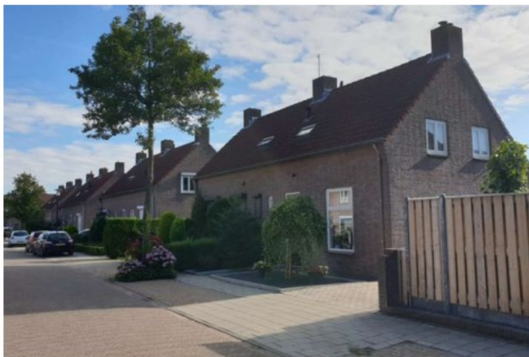
Twee-onder-een-kapwoningen Molenstraat 26 - 40 (even)

De Molenstraat 26 – 40 (even) is kadastraal bekend als gemeente Sprang, sectie B, nummer 2452 en kent een totale oppervlakte van 2.210 m 2 . De woningen ter plaatse betreffen vier twee-onder-een-kapwoningen (8 woningen), bestaande uit één bouwlaag plus kap. De woningen kennen een goot- en bouwhoogte van respectievelijk circa 3,5 en 6,5 meter.