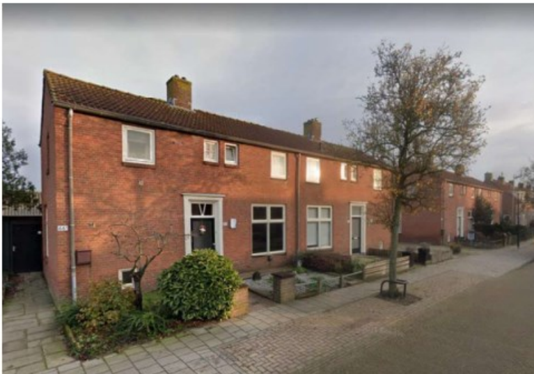
Beneden-/bovenwoningen Molenstraat 60 – 66A (even) (google Street view, 2021)

De Molenstraat 60 – 66A (even) is kadastraal bekend als gemeente Sprang, sectie B, nummer 5673 en kent een totale oppervlakte van 1.294 m 2 . Ter plaatse bevinden zich 8 boven- / benedenwoningen. De woningen hebben de uitstraling van een ruime twee-onder-een-kapwoning bestaande uit twee bouwlagen met kap met een bijbehorende goot- en bouwhoogte van respectievelijk 5 en 8 meter.