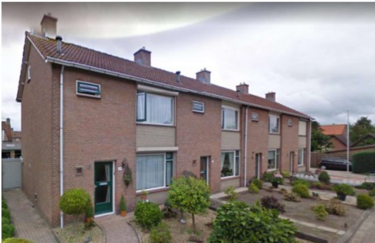
Rijwoningen Burgemeester Smitsstraat 29 – 35 (oneven)

De Burgemeester Smitsstraat 29 – 35 (oneven) is kadastraal bekend als gemeente Sprang, sectie B, nummer 5966 en kent een totale oppervlakte van 823 m 2 . Ter plaatse bevinden zich vier rijwoningen, bestaande uit twee bouwlagen plus kap. De woningen kennen een goot- en bouwhoogte van respectievelijk 6 en 9 meter.