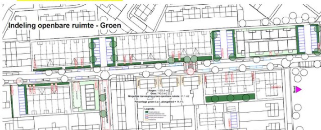
Indeling openbare ruimte – Groen (Casade, 2022)

Binnen het plangebied wordt een bestaande woonwijk geherstructureerd. Door de vervanging van de bestaande grondgebonden woningen door 39 grondgebonden eengezinswoningen, 12 seniorenwoningen en 30 appartementen ontstaat ruimte voor groen. In totaal wordt er 1.025,9 m 2 aan hagen aangeplant, 743 m 2 gras en 51,1 m 2 openbaar groen. Het percentage groen ten opzichte van het plangebied bedraagt daarmee 14,4%. Bij dit plan is dan ook sprake van een behoorlijke toename van (openbaar) groen. Het plan voldoet daarmee aan de ambities uit de Groenbeleidsvisie.