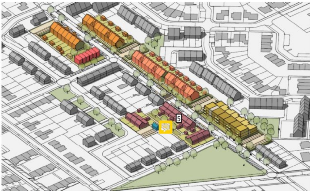
Stedenbouwkundig ontwerp (Loods Architecten, 2022)

Voor de mogelijke nieuwbouw is, samen met Loods Architecten, een stedenbouwkundige visie opgesteld. Na de sloop van de 58 bestaande woningen, worden 39 grondgebonden eengezinswoningen, 12 seniorenwoningen en 30 appartementen gerealiseerd. Er worden 23 woningen/appartementen toegevoegd ten opzichte van de bestaande situatie.