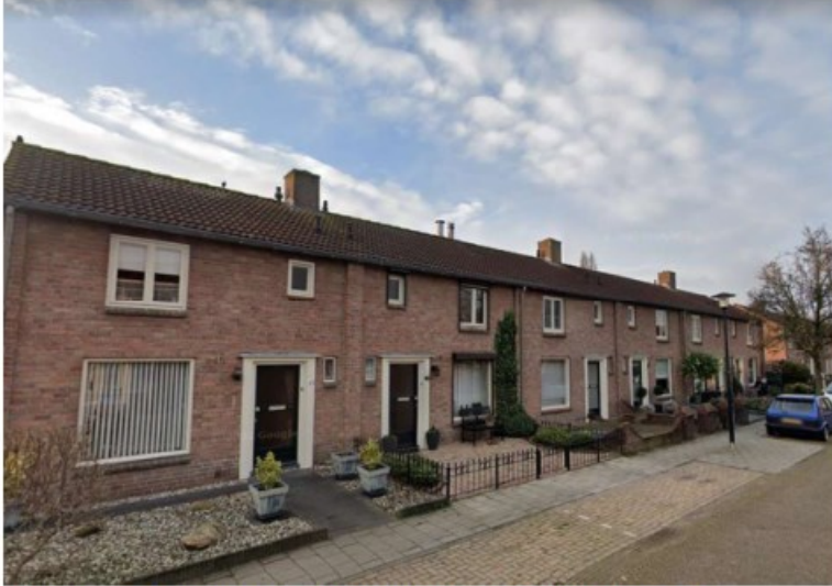
Rijwoningen Molenstraat 27 – 97 (oneven) (google Street view, 2021)

De Molenstraat 27 – 97 (oneven) is kadastraal bekend als gemeente Sprang, sectie C, nummer 1192 en kent een totale oppervlakte van 7.243 m 2 . De woningen ter plaatse betreffen vijf woonblokken met ieder 6 rijwoningen (30 woningen in totaal). De woningen bestaan uit twee bouwlagen met kap en een bijbehorende goot- en bouwhoogte van respectievelijk 5 en 8 meter.