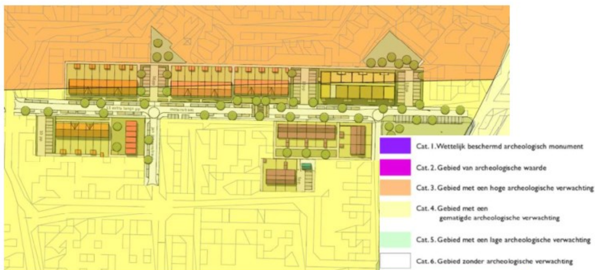
Archeologische beleidskaart gemeente Waalwijk ten opzichte van het structuurplan (gemeente Waalwijk, 2010)

Op grond van de Wet op de archeologische monumentenzorg (Wamz) is het verplicht om in nieuwe bestemmingsplannen rekening te houden met de mogelijke aanwezigheid van archeologische waarden. De gemeente Waalwijk heeft ten behoeve van het archeologiebeleid een kaart opgesteld.