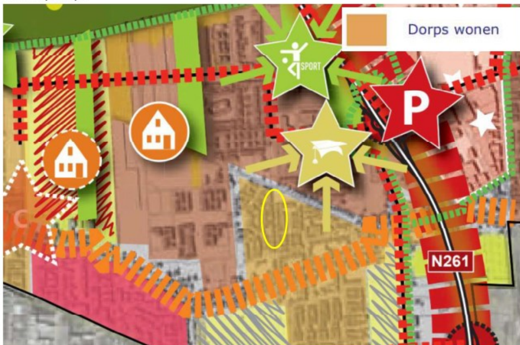
Uitsnede structuurvisie Waalwijk, plangebied geel omcirkeld (Gemeente Waalwijk, 2016)

Als thema loopt duurzaamheid als een 'ladder' door alle ambities heen en is daarom apart uitgewerkt in de structuurvisie. Aan deze 'duurzaamheidsladder' zijn ook een aantal specifieke onderwerpen gekoppeld: milieu, energie, erfgoed en sociaal. Duurzaamheid is voor de gemeente een algemeen leidend principe. De gemeente beschouwt het als haar plicht om de ontwikkeling van de huidige generatie te bevorderen, maar daarbij de ontwikkeling van de generaties hierna niet te belemmeren door de impact van onze huidige activiteiten en keuzes. Daarbij heeft de gemeente onder andere de ambitie om op de lange termijn (2043) klimaatneutraal te zijn. Klimaatneutraliteit is een zeer ambitieuze doelstelling die pas op de heel lange termijn kan worden gerealiseerd, ook als een maximale inspanning wordt geleverd. Om toe te werken naar deze doelstelling gebruikt de gemeente de 'trias energetica' (energievraag, duurzame bronnen en fossiele energiebronnen) als leidend principe.