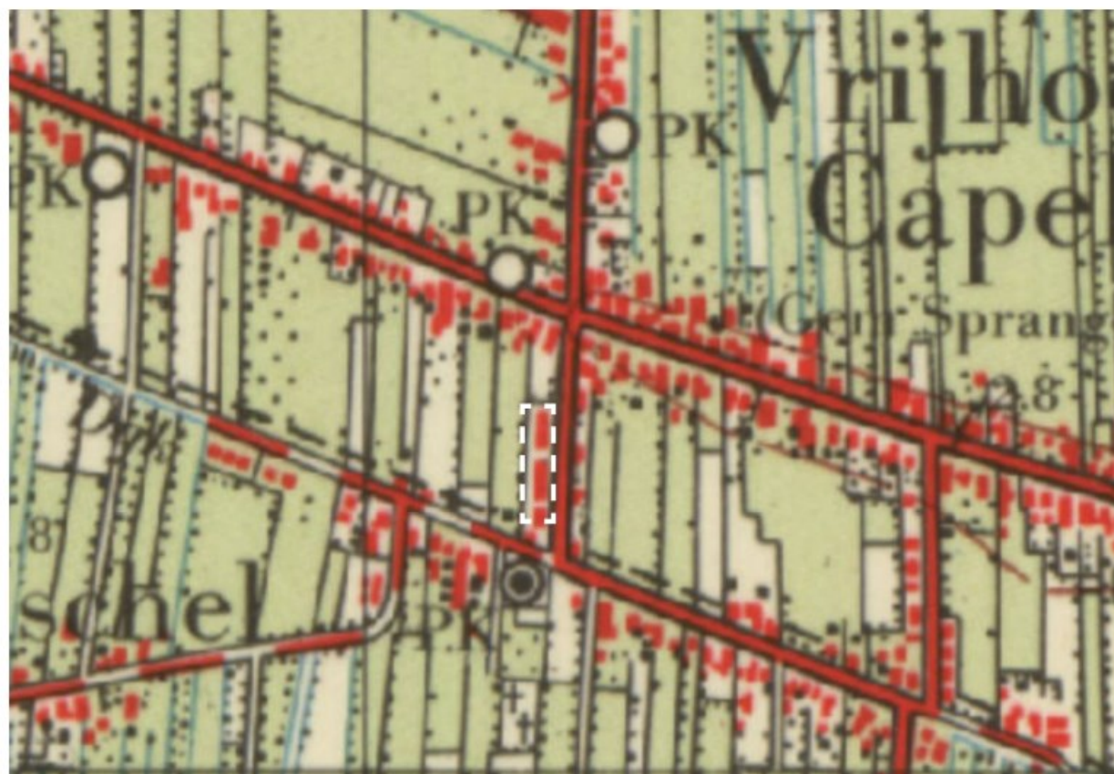
Historische kaart rond 1960