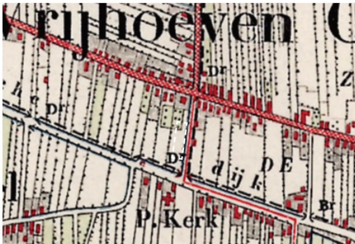
Historische kaart rond 1900