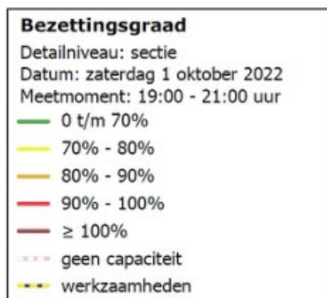
Figuur 3: Parkeerbezettingsgraad inclusief foutparkeren; maatgevend (drukste) moment: zaterdag 1 okt. 2022; 19:00-21:00 uur