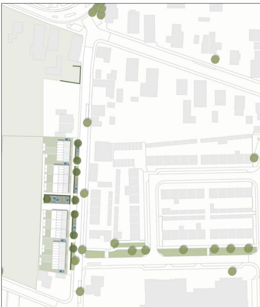
Figuur 1: Stedenbouwkundig plan Loonsestraatp

Stichting Casade onderzoekt de mogelijkheid om 14 woningen aan de Loonsestraat in Sprang-Capelle te slopen en te vervangen door nieuwbouw. Het gaat om Loonsestraat 10-36 (even). Voor de nieuwe situatie ligt er een concept stedenbouwkundig plan dat uitgaat van 19 woningen (7 eengezinswoningen, 12 boven- en benedenwoningen). Uiteindelijk zal het definitieve stedenbouwkundig plan vormgegeven worden in samenspraak met gemeente en omwonenden dus in het rapport is flexibiliteit in aantallen en types gewenst. Onderstaande figuur toont het Stedenbouwkundig plan november 2022. De bewoners zijn op de hoogte van de voorgenomen sloop van hun woning.