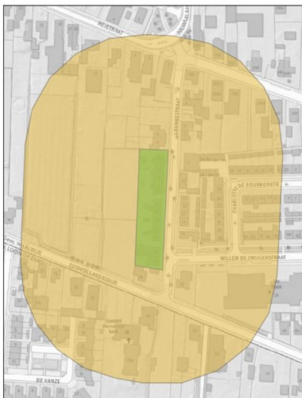
Figuur 1.1: Globaal onderzoeksgebied Loonsestraat e.o. (let op: in het kaartje is een straat van 100m getoond, terwijl in dit onderzoek gekeken is naar een logische begrenzing op basis van een loopafstand van 100m).