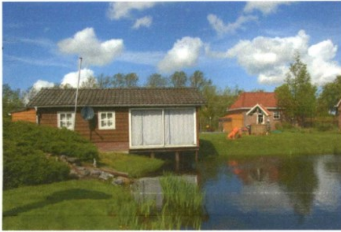
Tuinhuis bij de vijverpartij