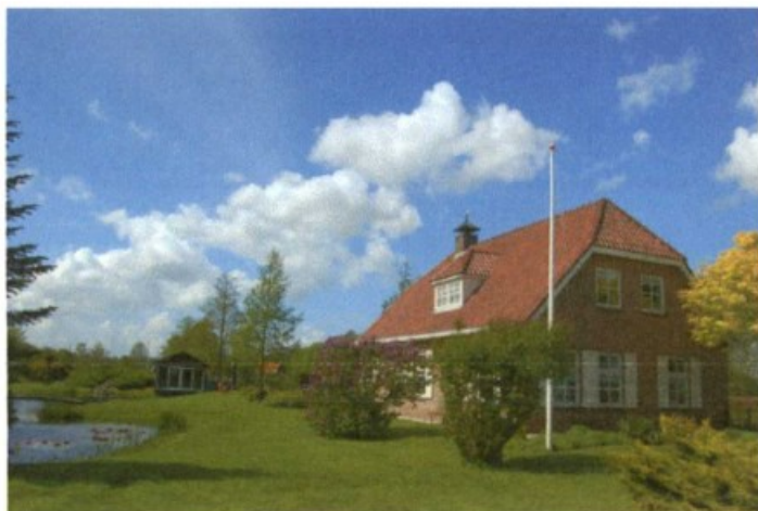
Frontzijde met siertuin en vijver links van de woning