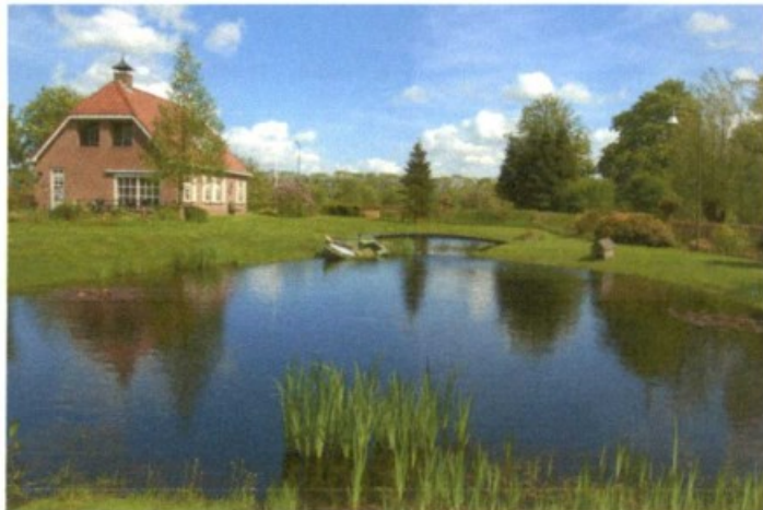
Siertuin met grote vijverpartij (natuurvijver)